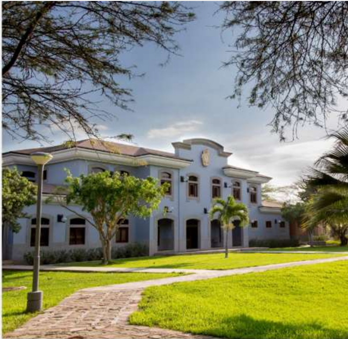
Edificio de Gobierno - Campus Piura