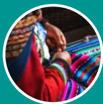
FUNDACIONES U ORGANISMOS DEDICADOS A LA COOPERACIÓN AL DESARROLLO