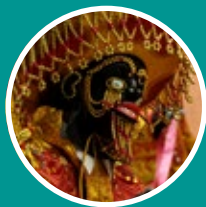
PATRIMONIO CULTURAL Y ARTES

El Historiador y Gestor Cultural es un profesional versátil que puede desempeñarse en: