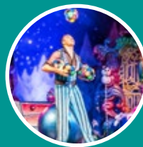
EMPRENDIMIENTOS Y PROYECTOS CULTURALES