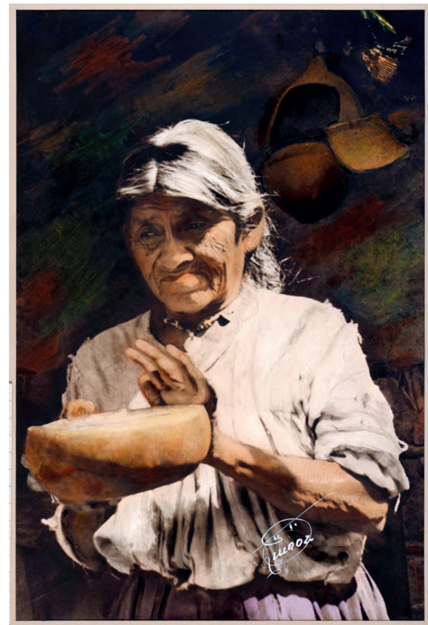
Limpiando su bebé, 1950. Foto-óleo sobre papel, 39 x 24 cm. Col. CIPCA.