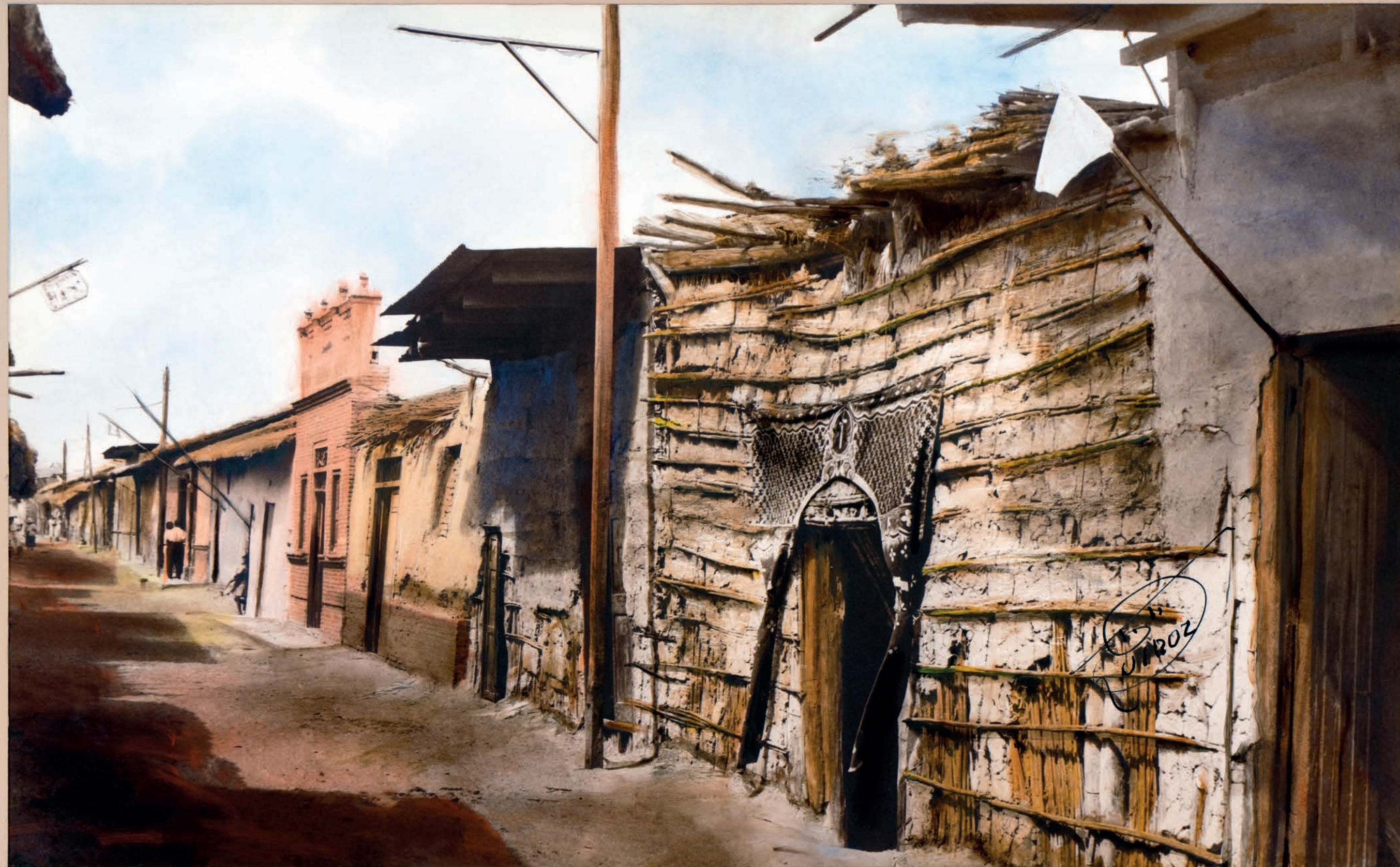
Casa en duelo , 1950. Foto-óleo sobre papel, 39 x 24 cm. Col. CIPCA.