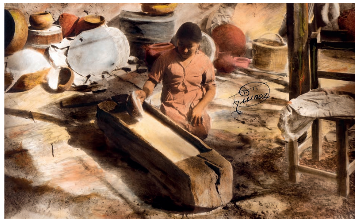
Enfriando la chicha y las cholitas , 1950. Foto-óleo sobre papel, 39.5 x 24 cm. Col. CIPCA.