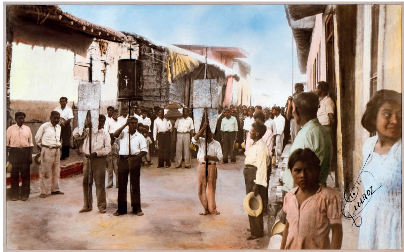
Entierro de un mayordomo, 1950. Foto-óleo sobre papel, 39 x 24 cm. Col. CIPCA.