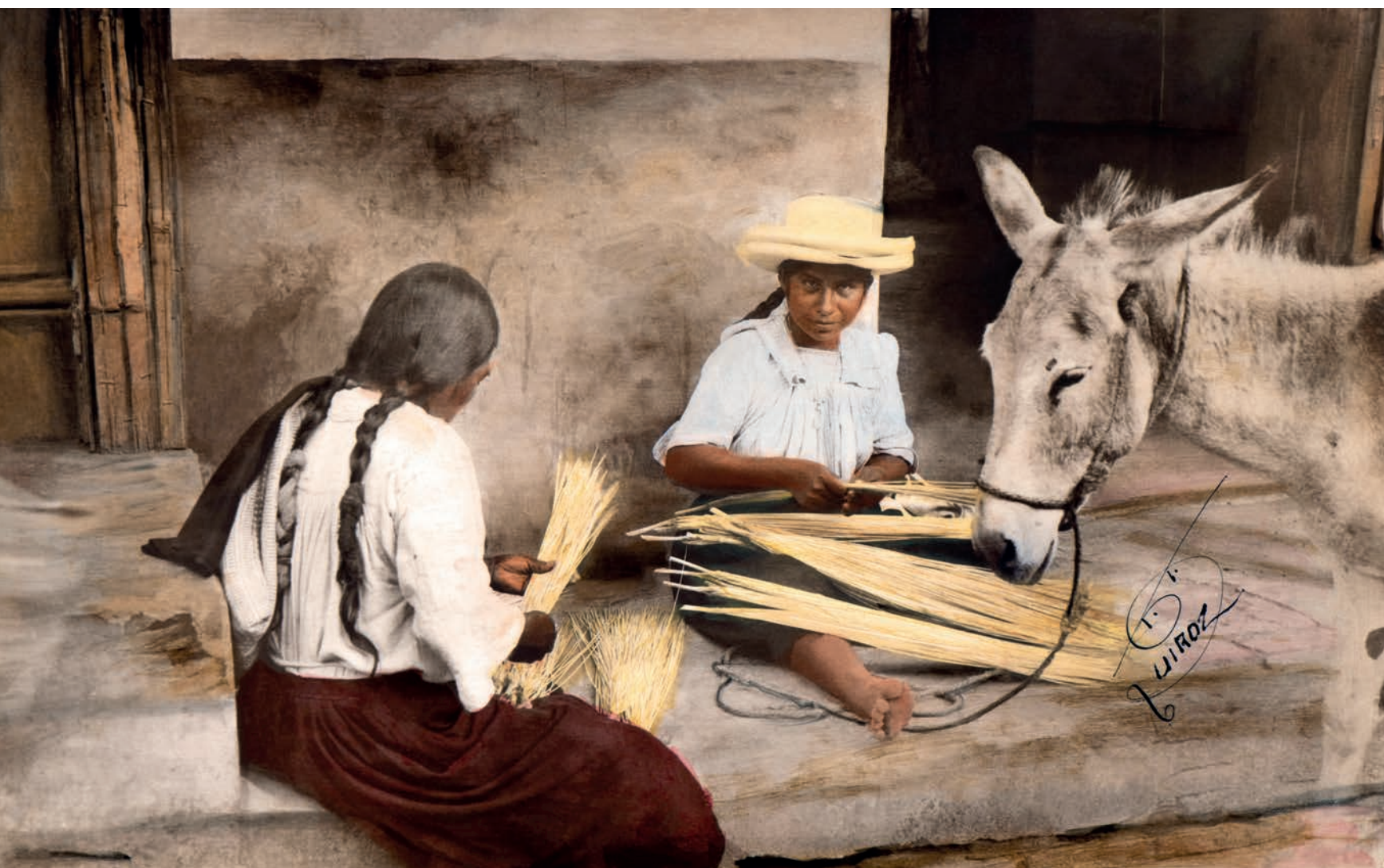
Escogiendo paja para los sombreros, 1950. Foto-óleo sobre papel, 39 x 24 cm. Col. CIPCA.