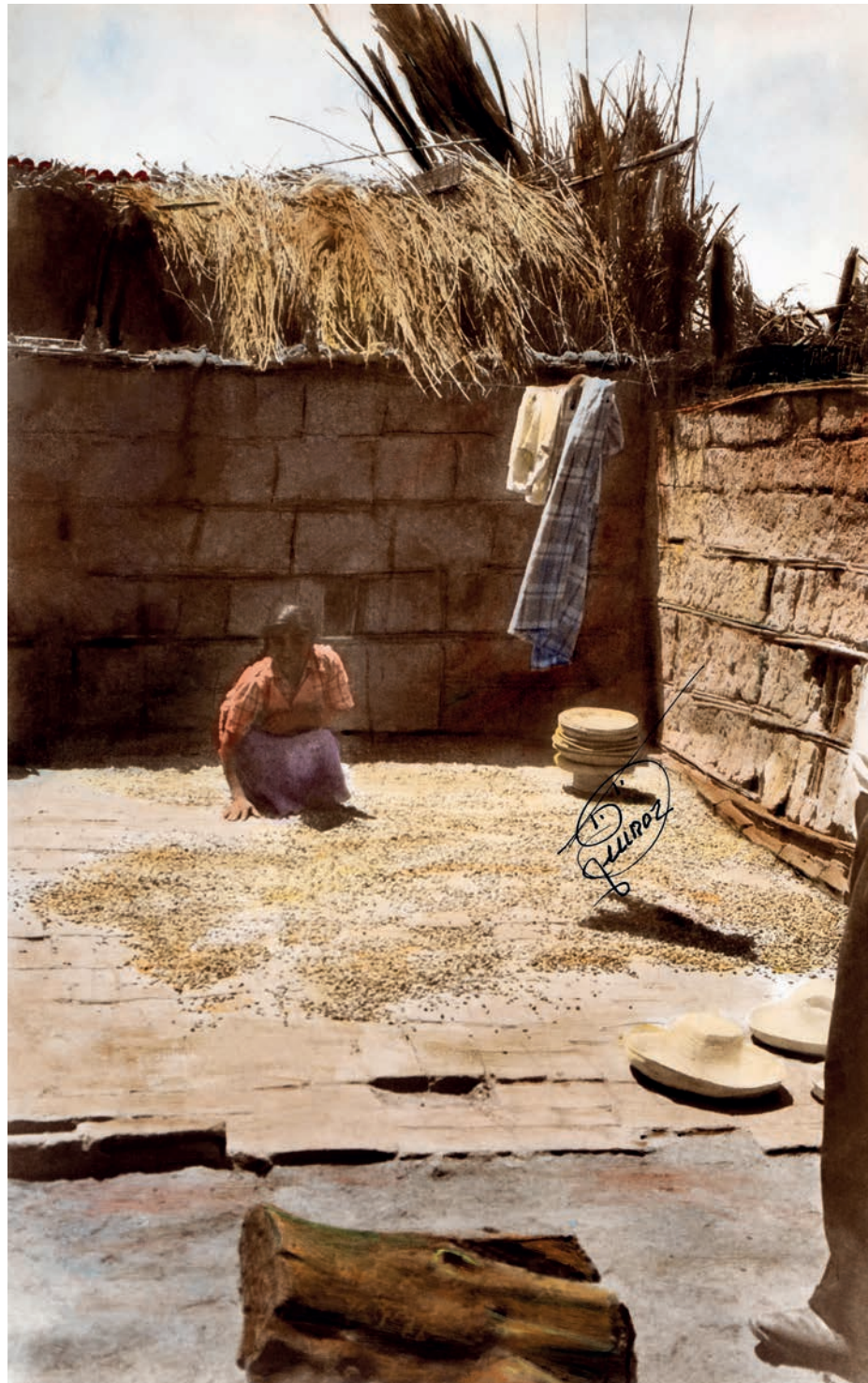
Secando jora, 1950. Foto-óleo sobre papel, 39.5 x 24 cm. Col. CIPCA.