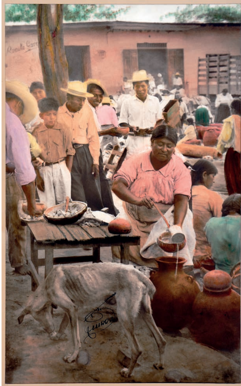
Un potito de cincuenta , 1950. Foto-óleo sobre papel, 39 x 24 cm. Col. CIPCA.