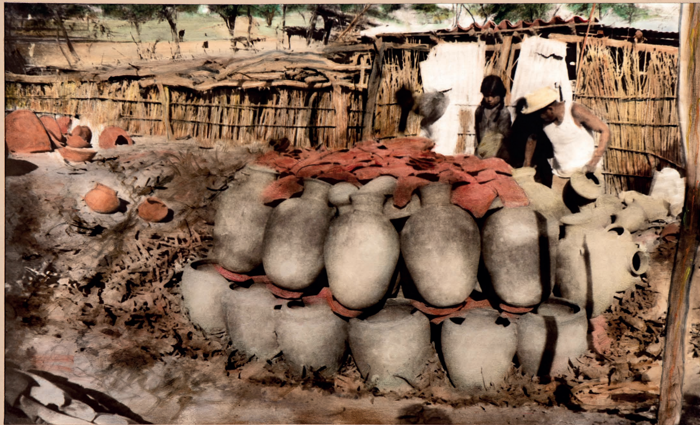
Armado de horno, 1950. Foto-óleo sobre papel, 39 x 24 cm. Col. CIPCA.