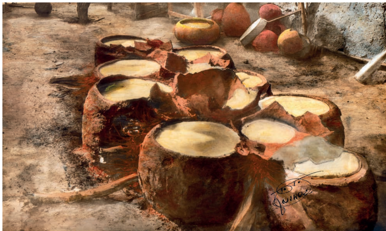
Cocinando chicha , 1950. Foto-óleo sobre papel, 39 x 24 cm. Col. CIPCA.