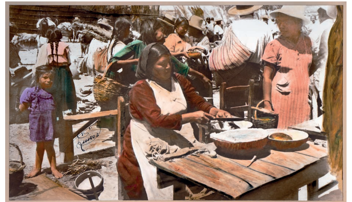
Preparando cebiche , 1950. Foto-óleo sobre papel, 39 x 24 cm. Col. CIPCA.