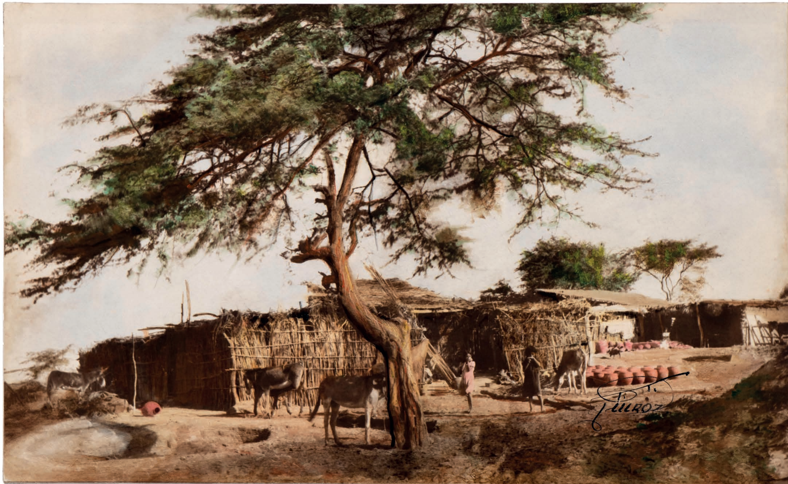
Simbilá. Casa de alfareros, 1950. Foto-óleo sobre papel, 39.2 x 24 cm.