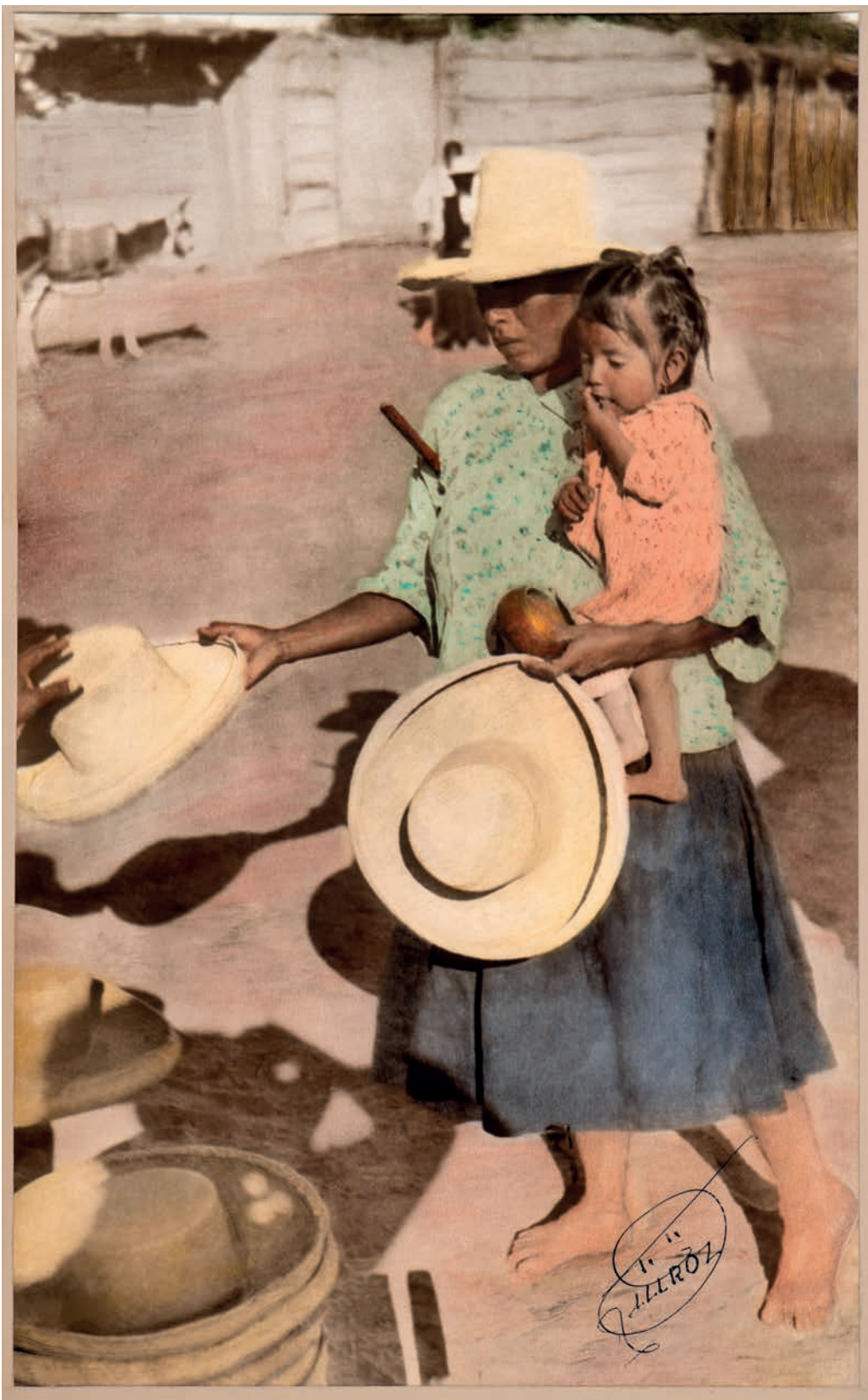
Viendo la calidad del sombrero para la compra, 1950. Foto-óleo sobre papel, 39 x 24 cm. Col. CIPCA.