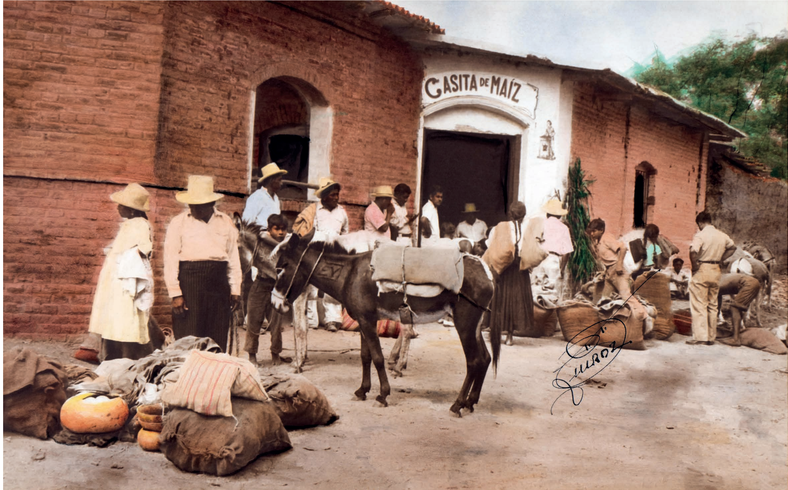
La Casa de maíz , 1950. Foto-óleo sobre papel, 39 x 24 cm. Col. CIPCA.