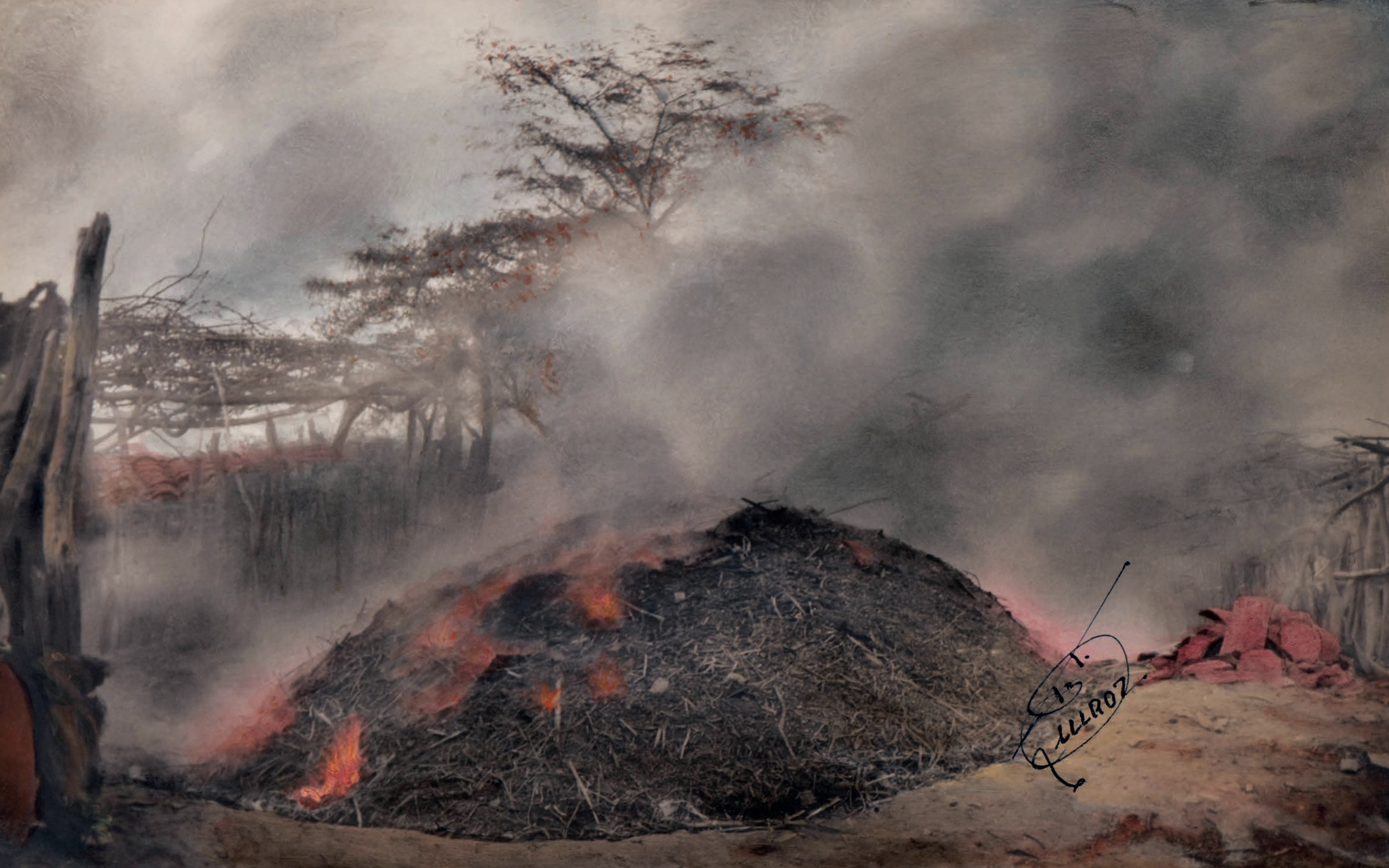
Quemando el horno , 1950. Foto-óleo sobre papel, 39 x 24 cm. Col. CIPCA.