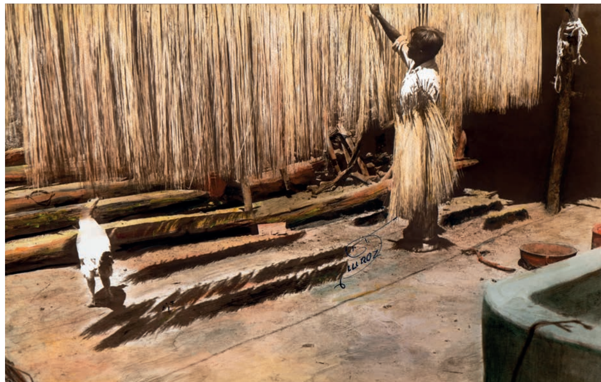
Paja al sol para blanquear , 1950. Foto-óleo sobre papel, 39 x 24 cm. Col. CIPCA.