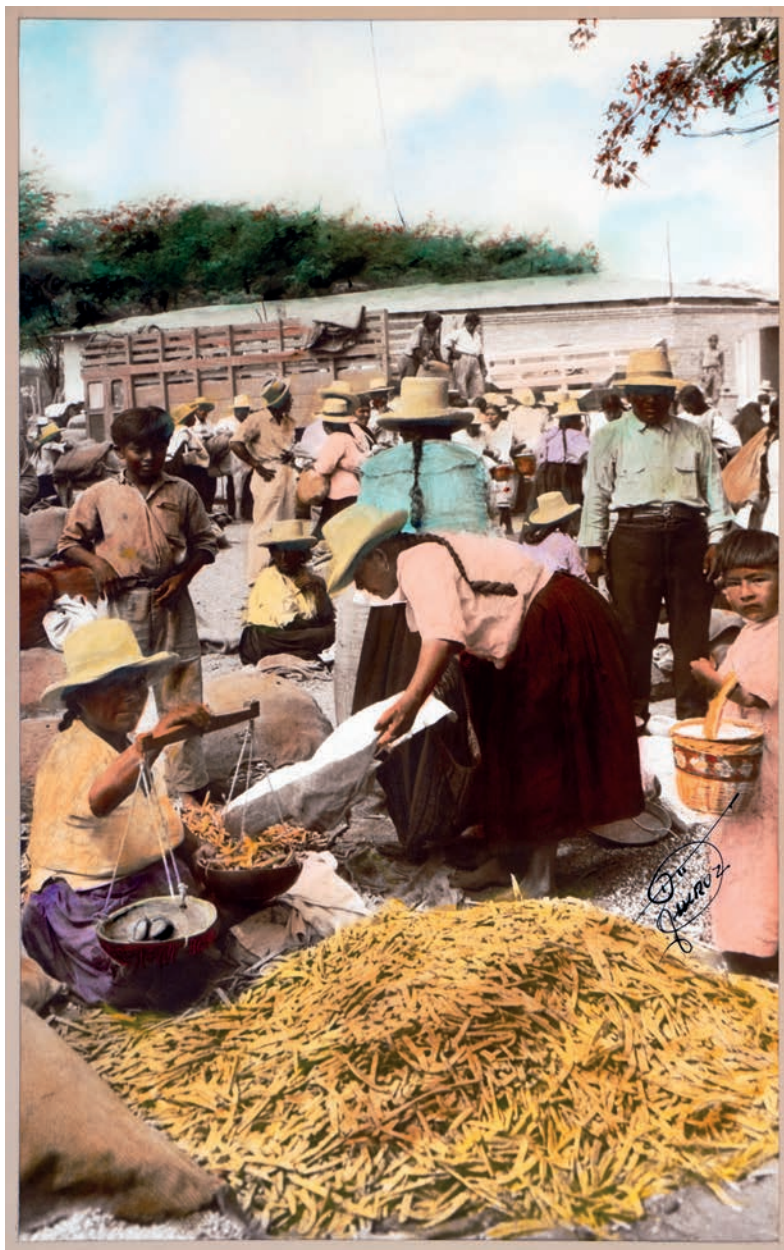
Pesando algarroba, 1950. Foto-óleo sobre papel, 39 x 24 cm. Col. CIPCA.