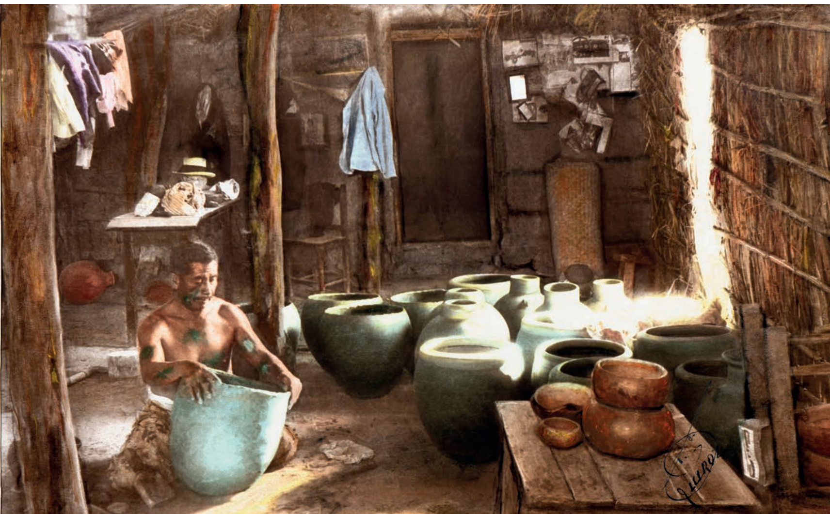
Pulimento , 1950. Foto-óleo sobre papel, 39 x 24 cm. Col. CIPCA.