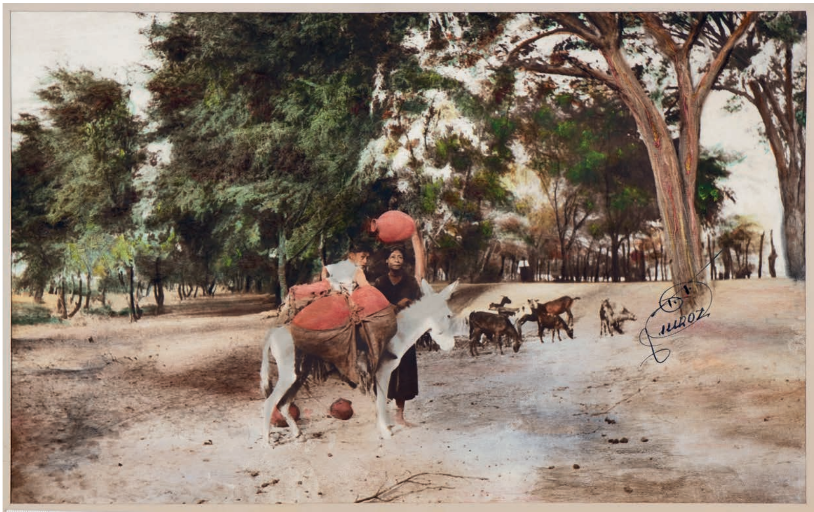
Llevando cántaros a vender de Simbilá a Catacaos, 1950. Foto-óleo sobre papel, 39 x 24 cm. Col. CIPCA.