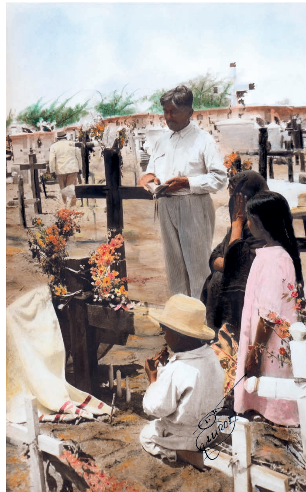
Rezador , 1950. Foto-óleo sobre papel, 39 x 24 cm. Col. CIPCA.