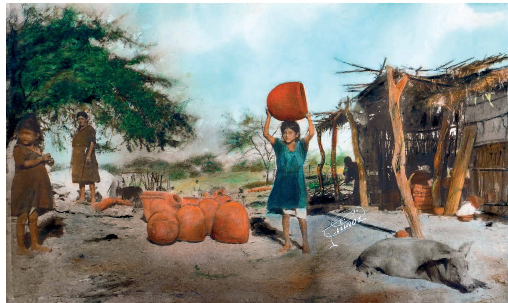
Llevando a vender , 1950. Foto-óleo sobre papel, 39.5 x 24 cm. Col. CIPCA.