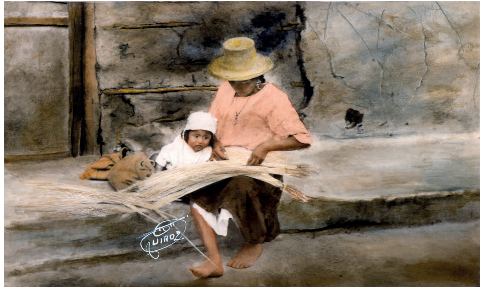
Escogedora de paja , 1950. Foto-óleo sobre papel, 39.5 x 24 cm. Col. CIPCA.