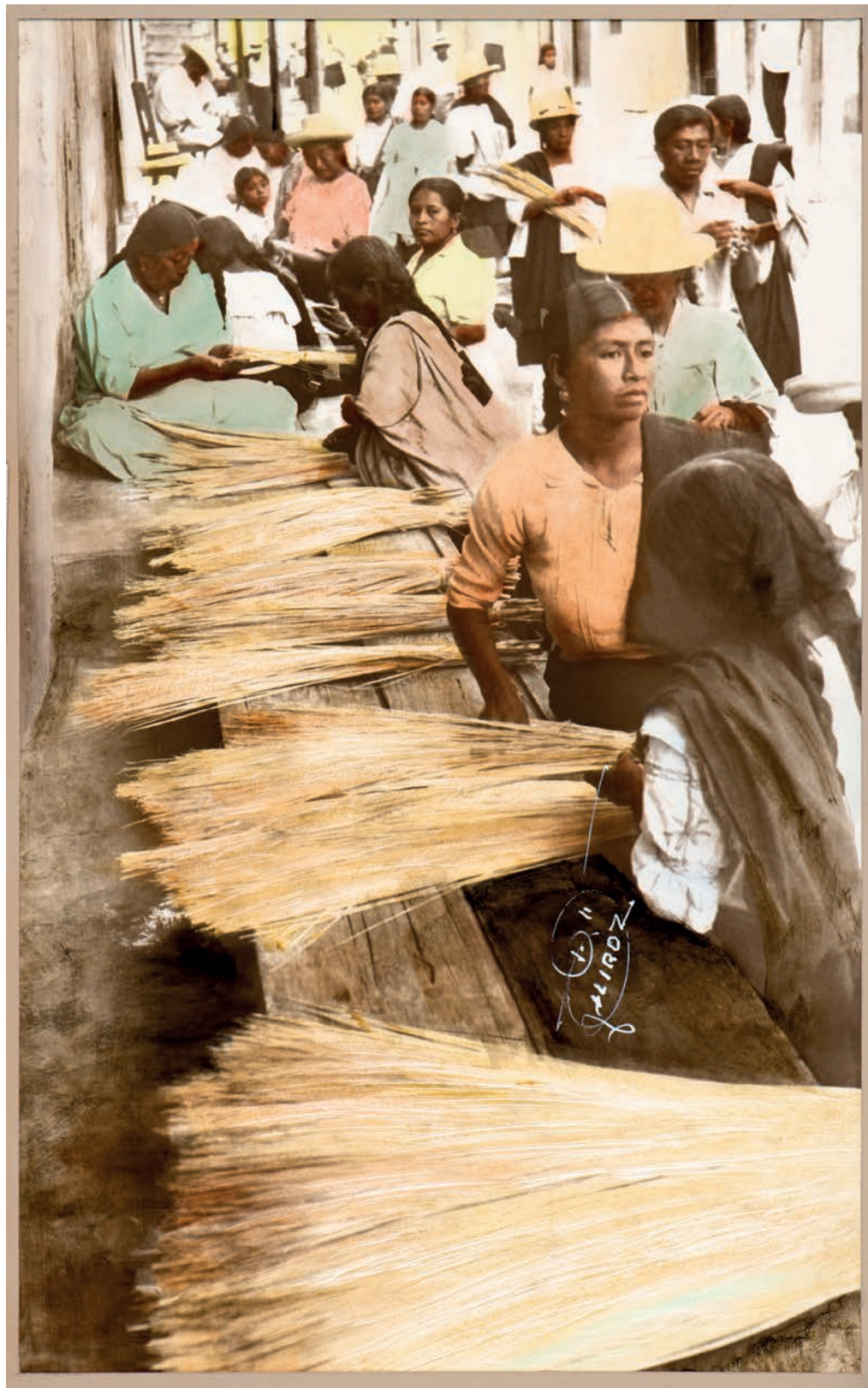
Venta dominical de paja , 1950. Foto-óleo sobre papel, 39 x 24 cm. Col. CIPCA.