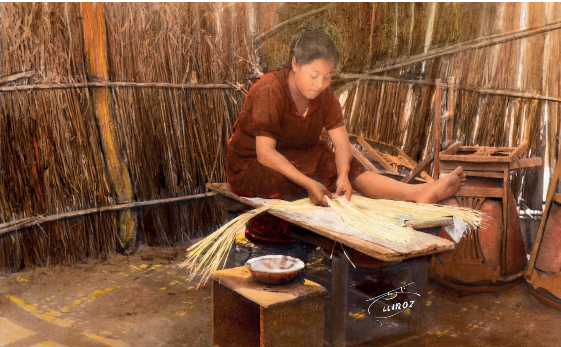
Tejedora de sombrero fino, 1950. Foto-óleo sobre papel, 39 x 24 cm. Col. CIPCA.