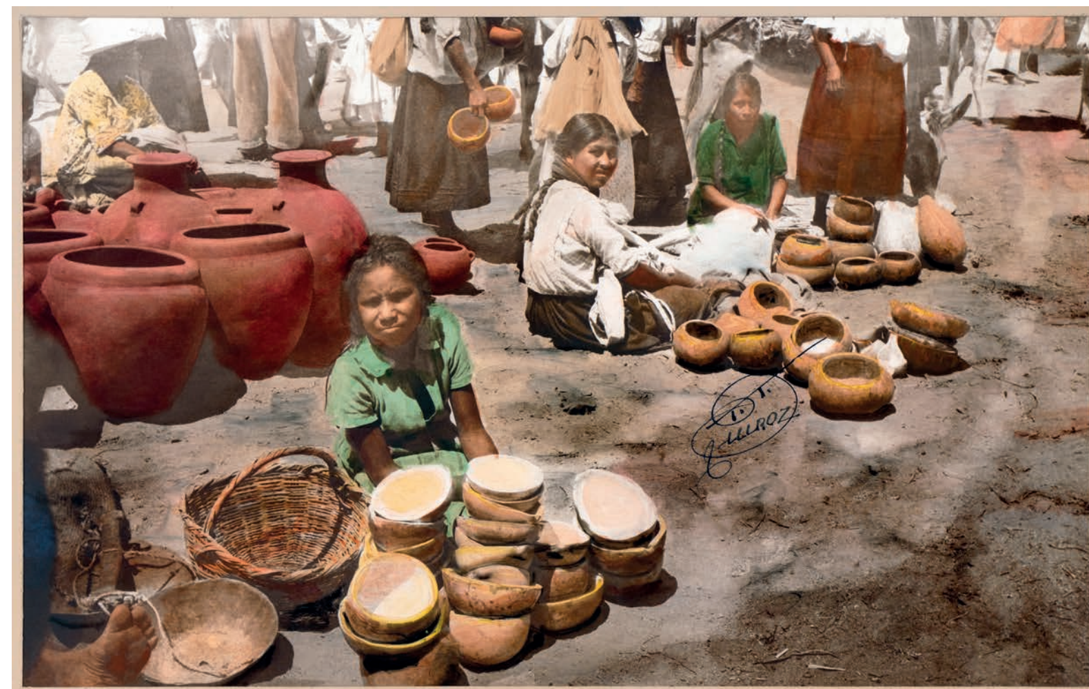
Venta de mates y potos, 1950. Foto-óleo sobre papel, 39 x 24 cm. Col. CIPCA.