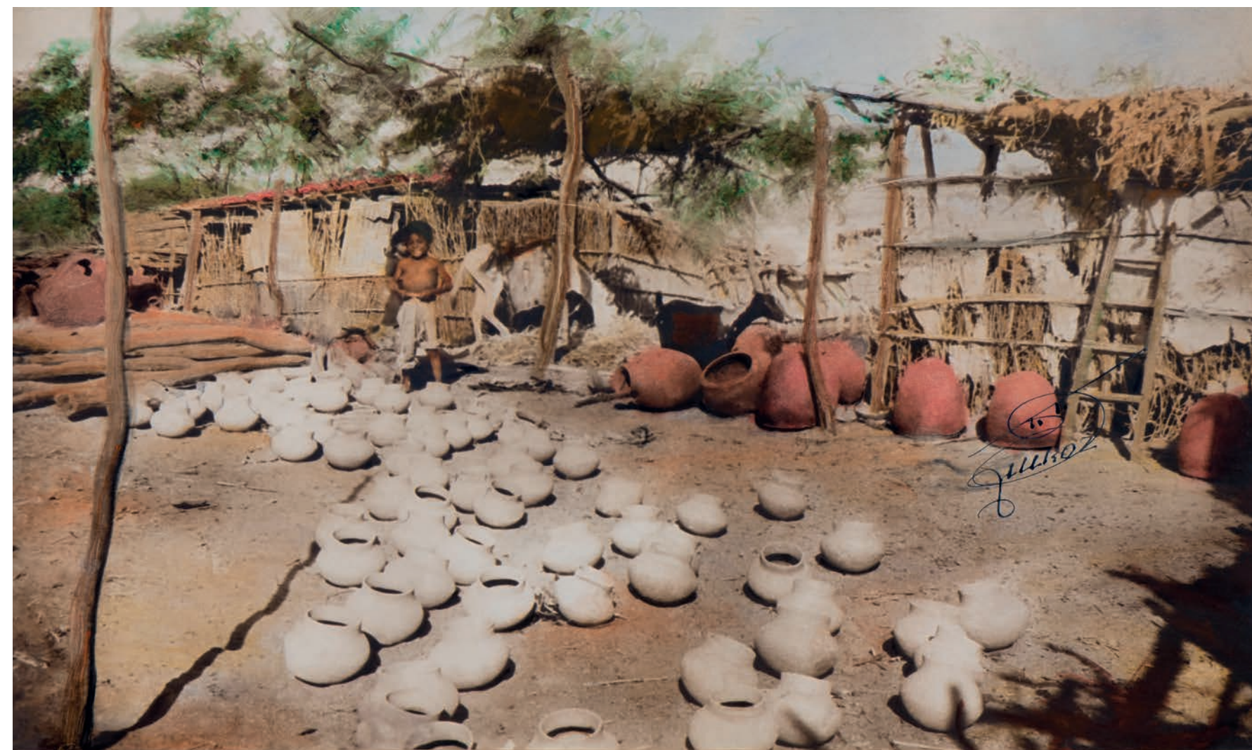
Secado de ollas de barro , 1950. Foto-óleo sobre papel, 39 x 24 cm. Col. CIPCA.