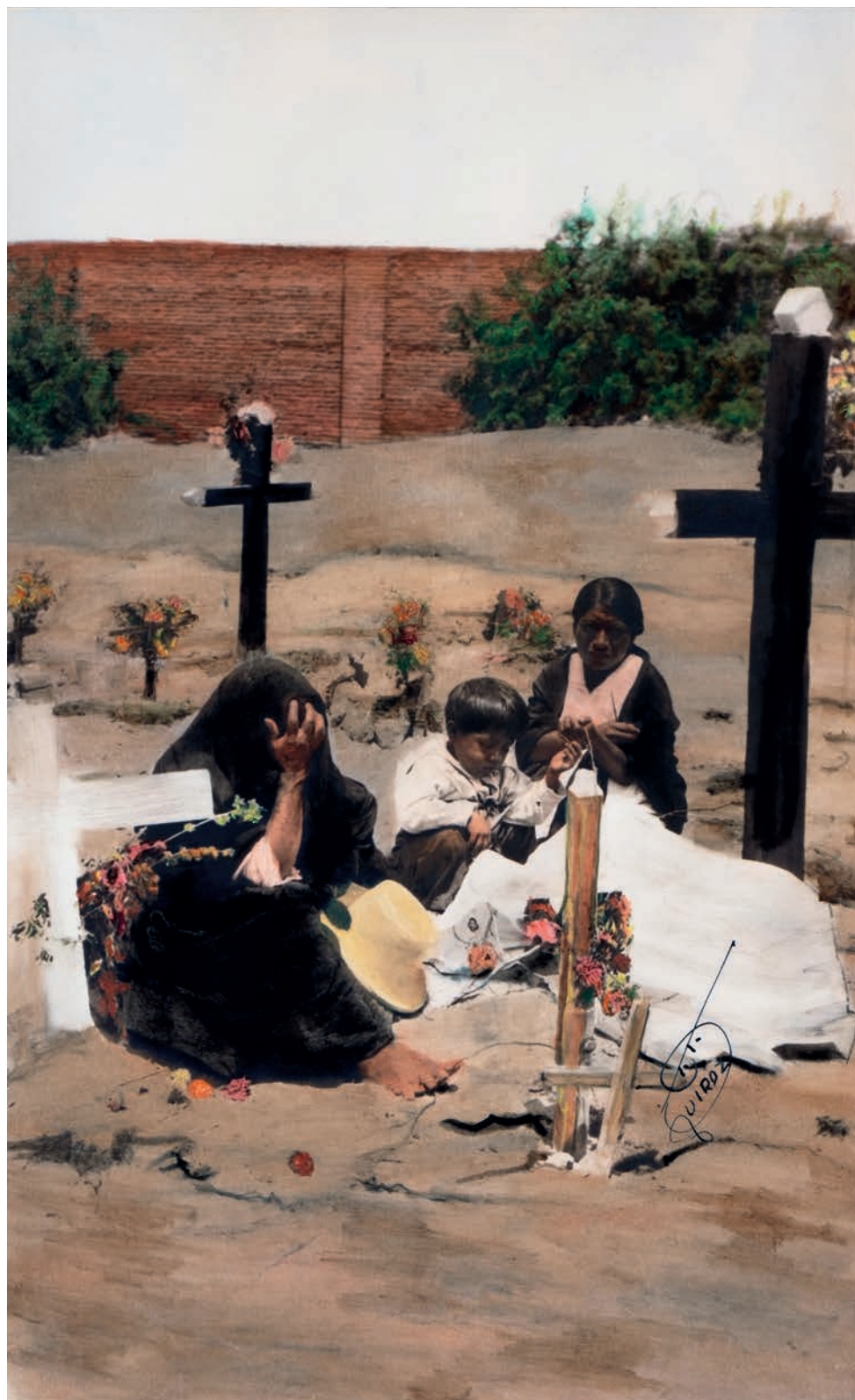
Velando , 1950. Foto-óleo sobre papel, 39 x 24 cm. Col. CIPCA.