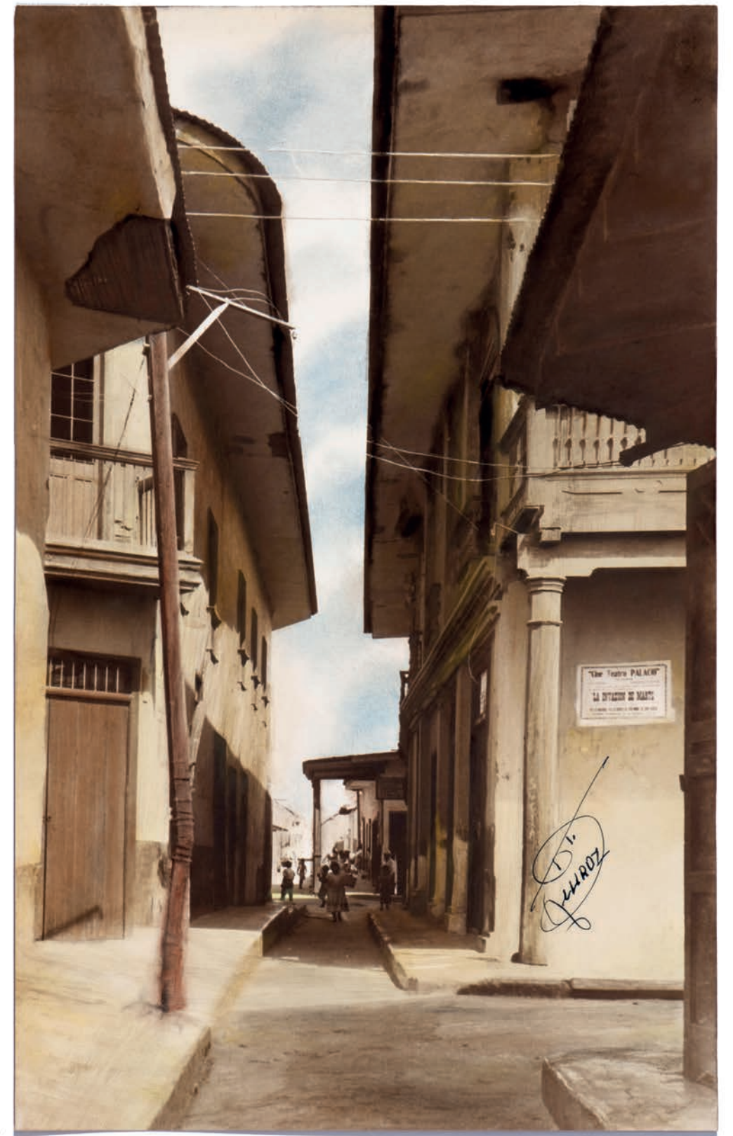
Callejón que conduce a Catacaos, 1950. Foto-óleo sobre papel, 39 x 24 cm. Col. CIPCA.