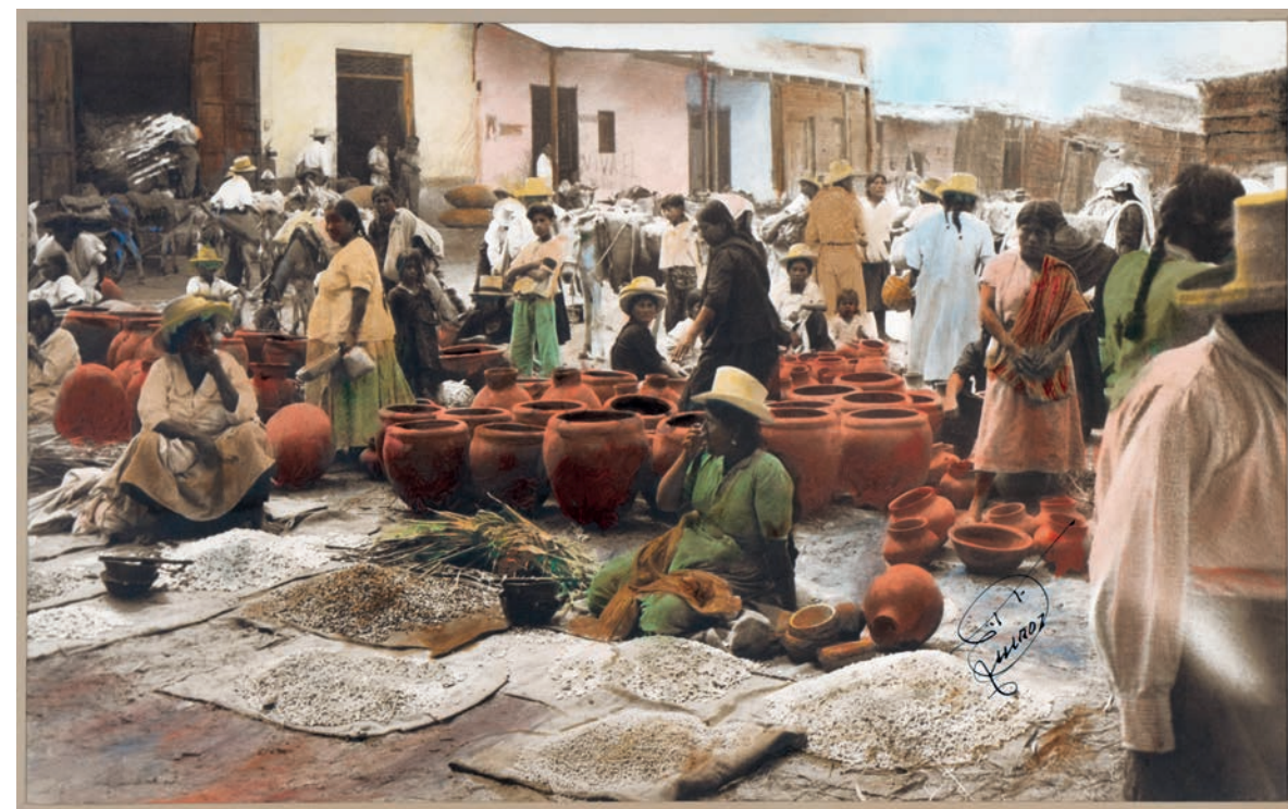
Venta de menestra fresca, 1950. Foto-óleo sobre papel, 39 x 24 cm. Col. CIPCA.