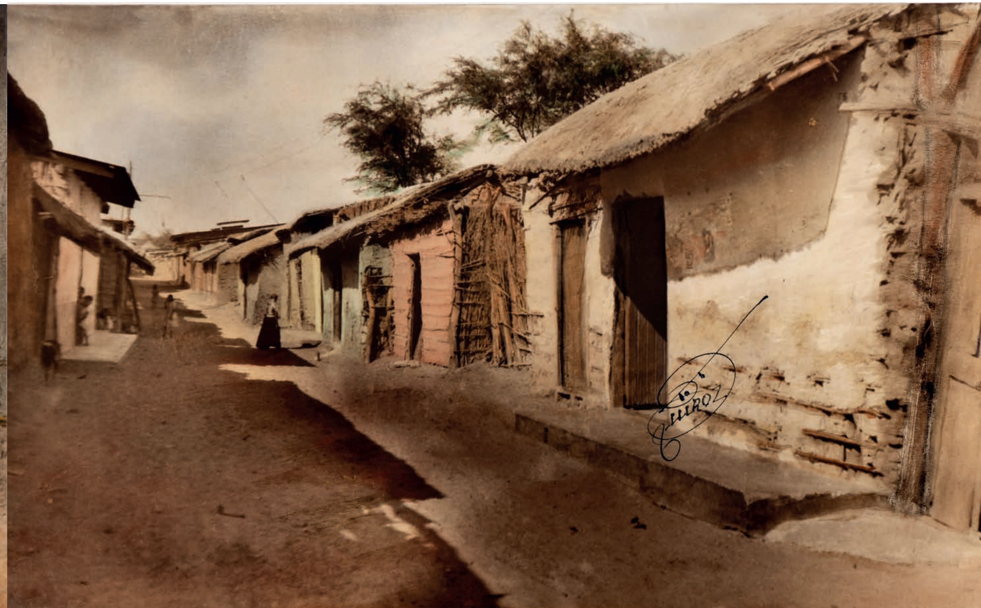
"La Malgeniada" , 1950. Foto-óleo sobre papel, 39.5 x 24 cm. Col. CIPCA.