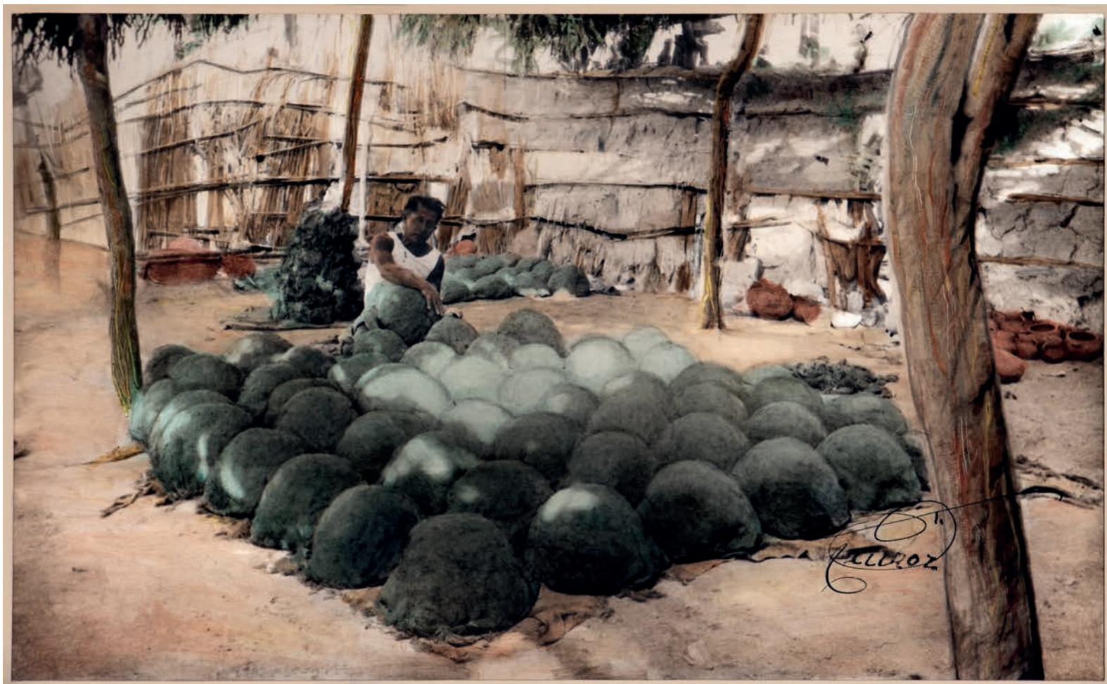
Primer día de trabajo , 1950. Foto-óleo sobre papel, 39 x 24 cm. Col. CIPCA.