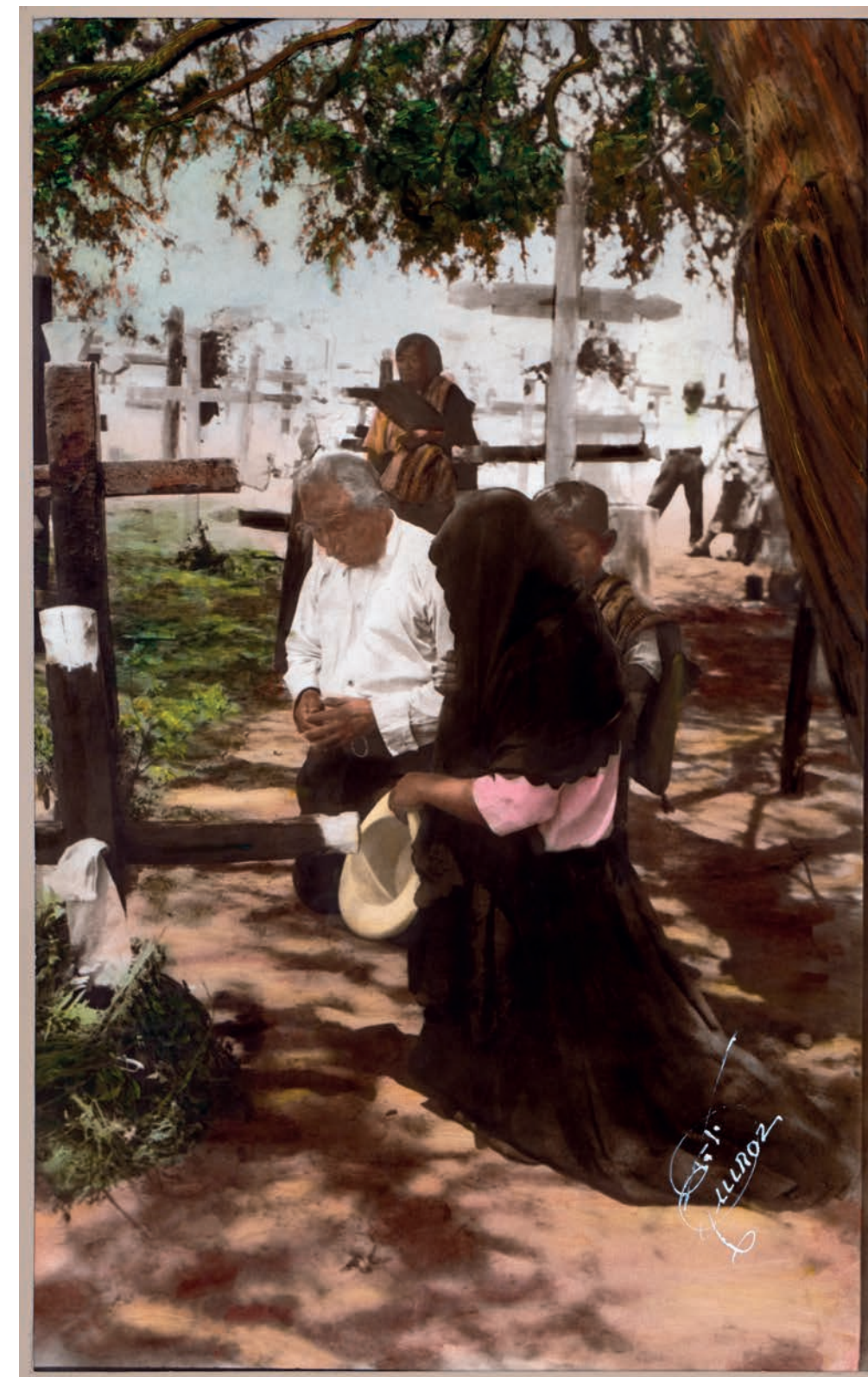
Rezando a su difunto , 1950. Foto-óleo sobre papel, 39 x 24 cm. Col. CIPCA.