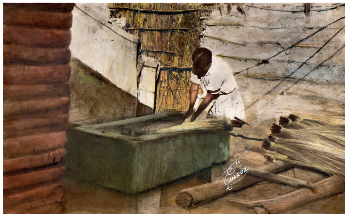
Lavando la paja , 1950. Foto-óleo sobre papel, 39.5 x 24 cm. Col. CIPCA.