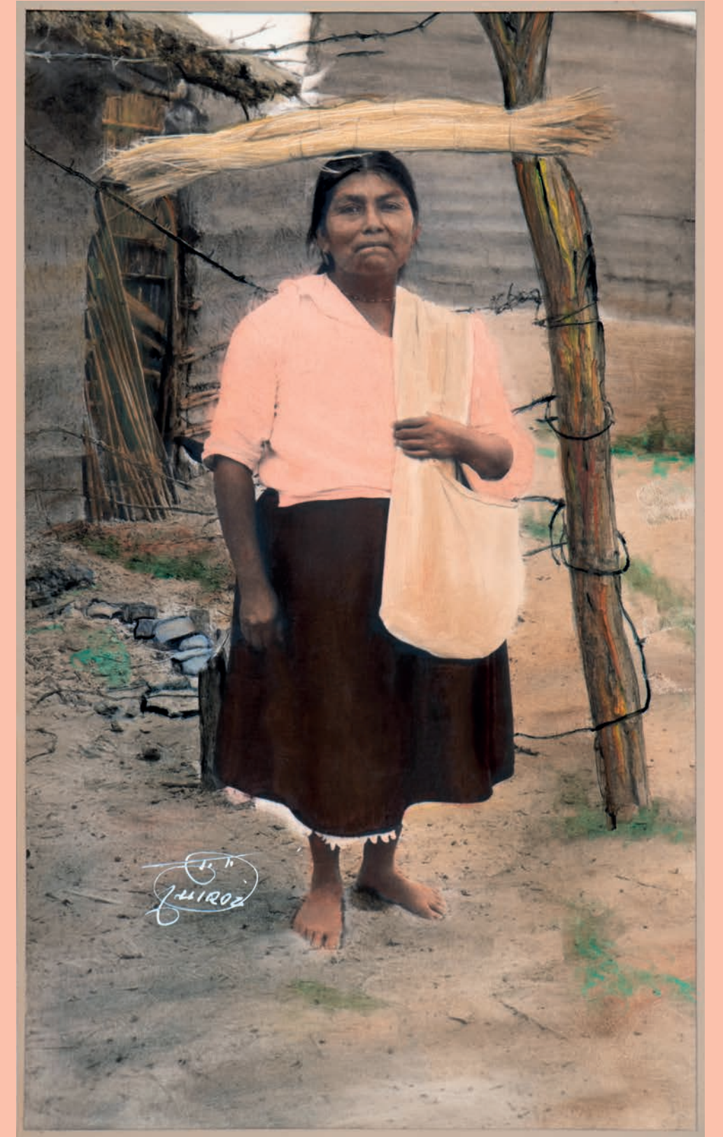
Llevando su paja comprada y seleccionada, 1950. Foto-óleo sobre papel, 39 x 24 cm. Col. CIPCA.

En ese relato, la muerte y las tradiciones asociadas a ella, las cuales se han mantenido casi intactas hasta antes de la pandemia, también concitan su atención, transmitiéndonos el rigor del luto, en contraste con los colores vivaces de este espacio.