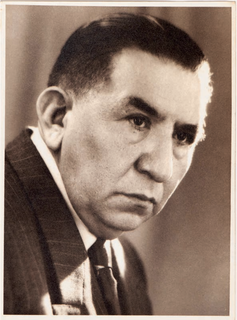
Autorretrato, C. 1950. Fotografía en gelatina de plata sobre papel, 18 x 24 cm. Col. CIPCA.