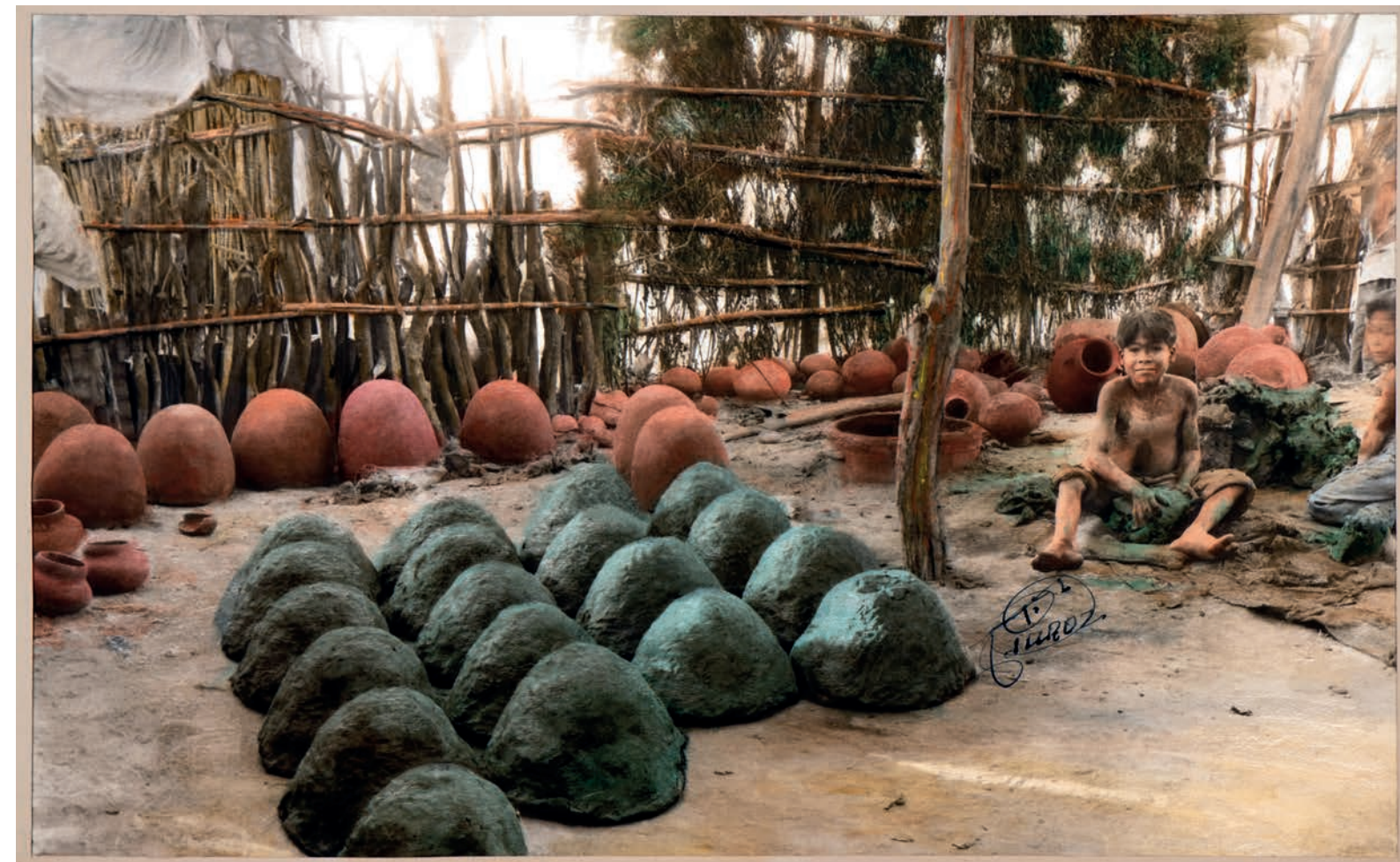
Segundo día de trabajo , 1950. Foto-óleo sobre papel, 39 x 24 cm. Col. CIPCA.