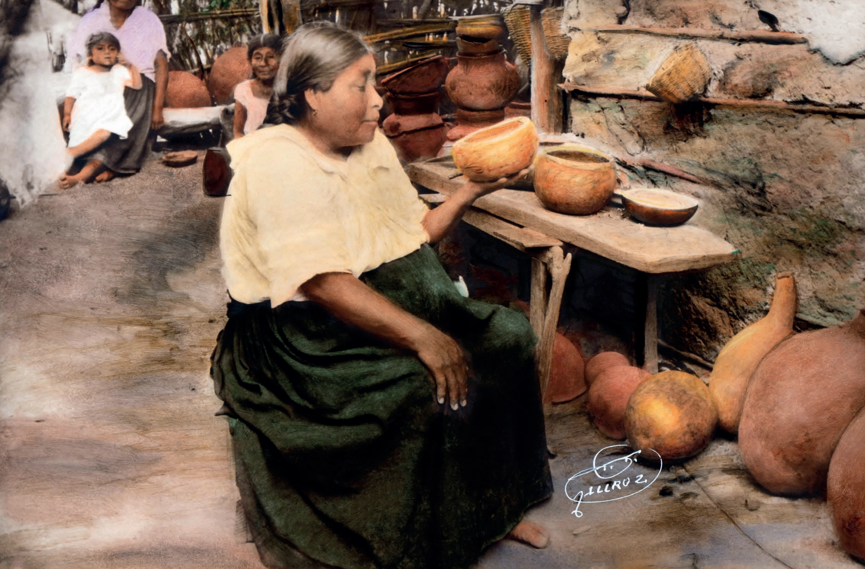
Un poto de claro para su sed, 1950. Foto-óleo sobre papel, 39 x 24 cm. Col. CIPCA.