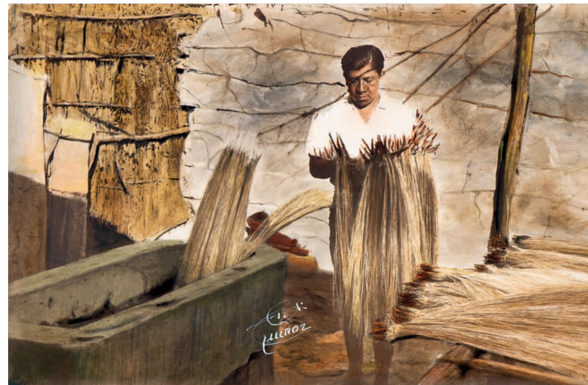
Haciendo ochos , 1950. Foto-óleo sobre papel, 39 x 24 cm. Col. CIPCA.