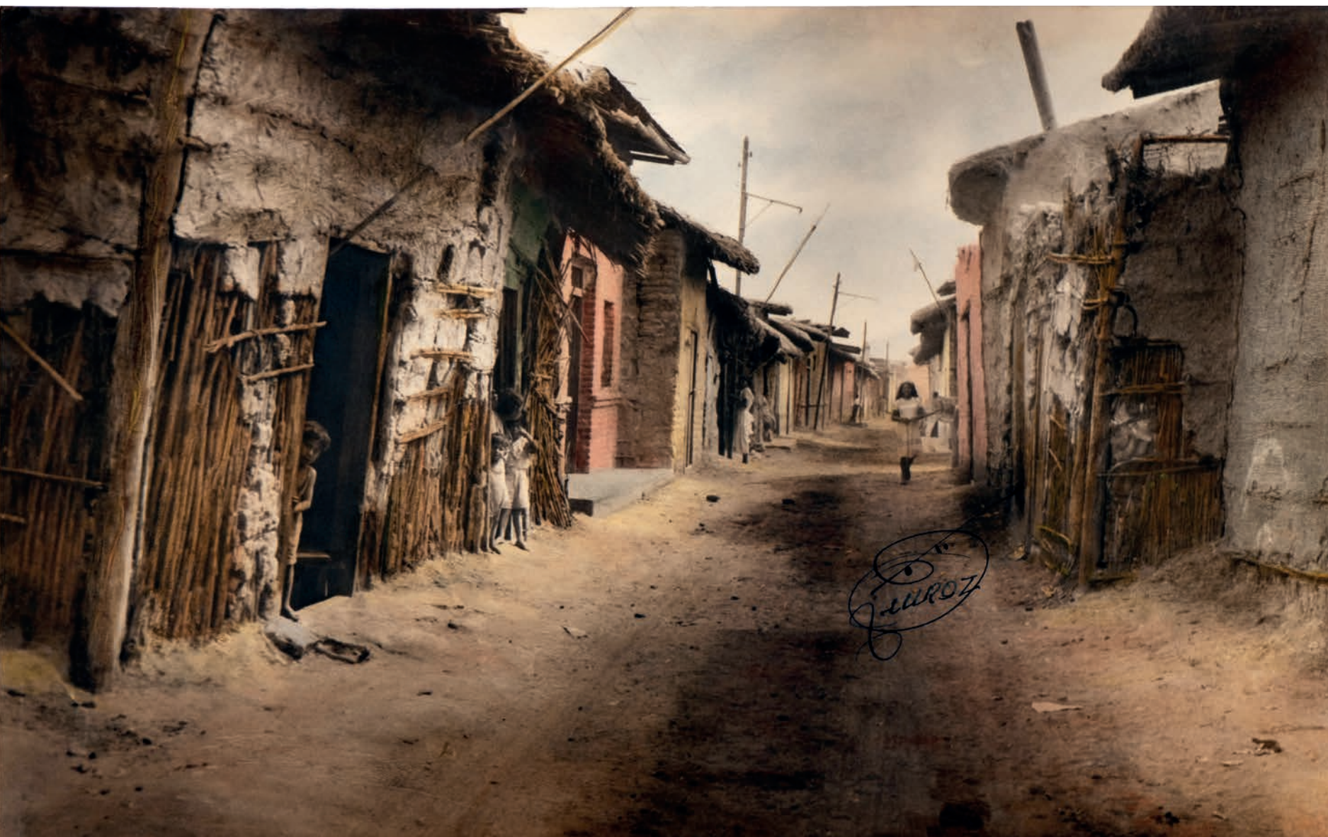
Una calle cataquense , 1950. Foto-óleo sobre papel, 39.5 x 24.5 cm.