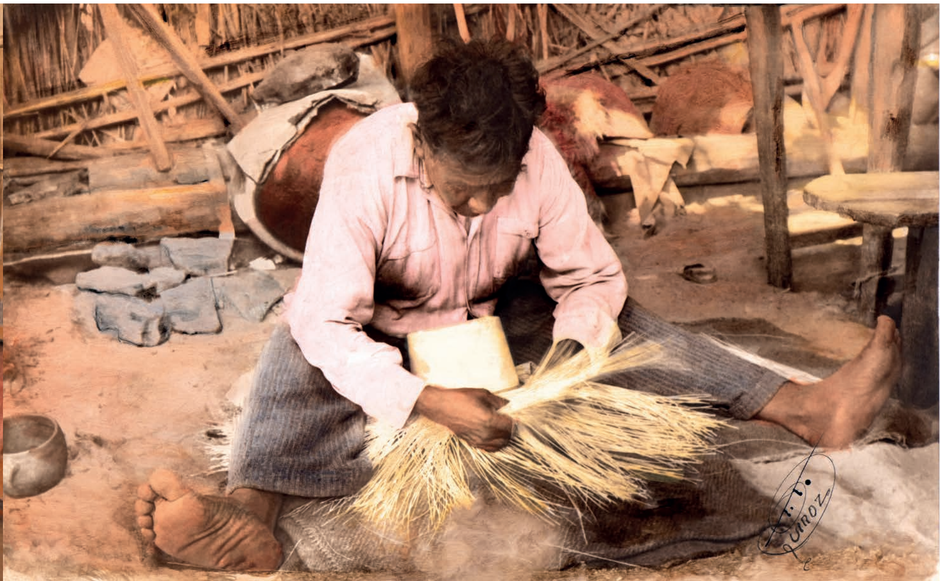
Tejedor de sombrero fino, 1950. Foto-óleo sobre papel, 39 x 24 cm. Col. CIPCA.