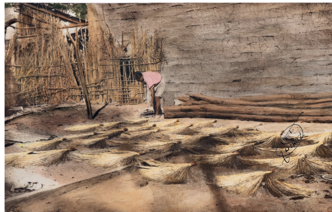
Secando paja , 1950. Foto-óleo sobre papel, 39.5 x 24 cm. Col. CIPCA.