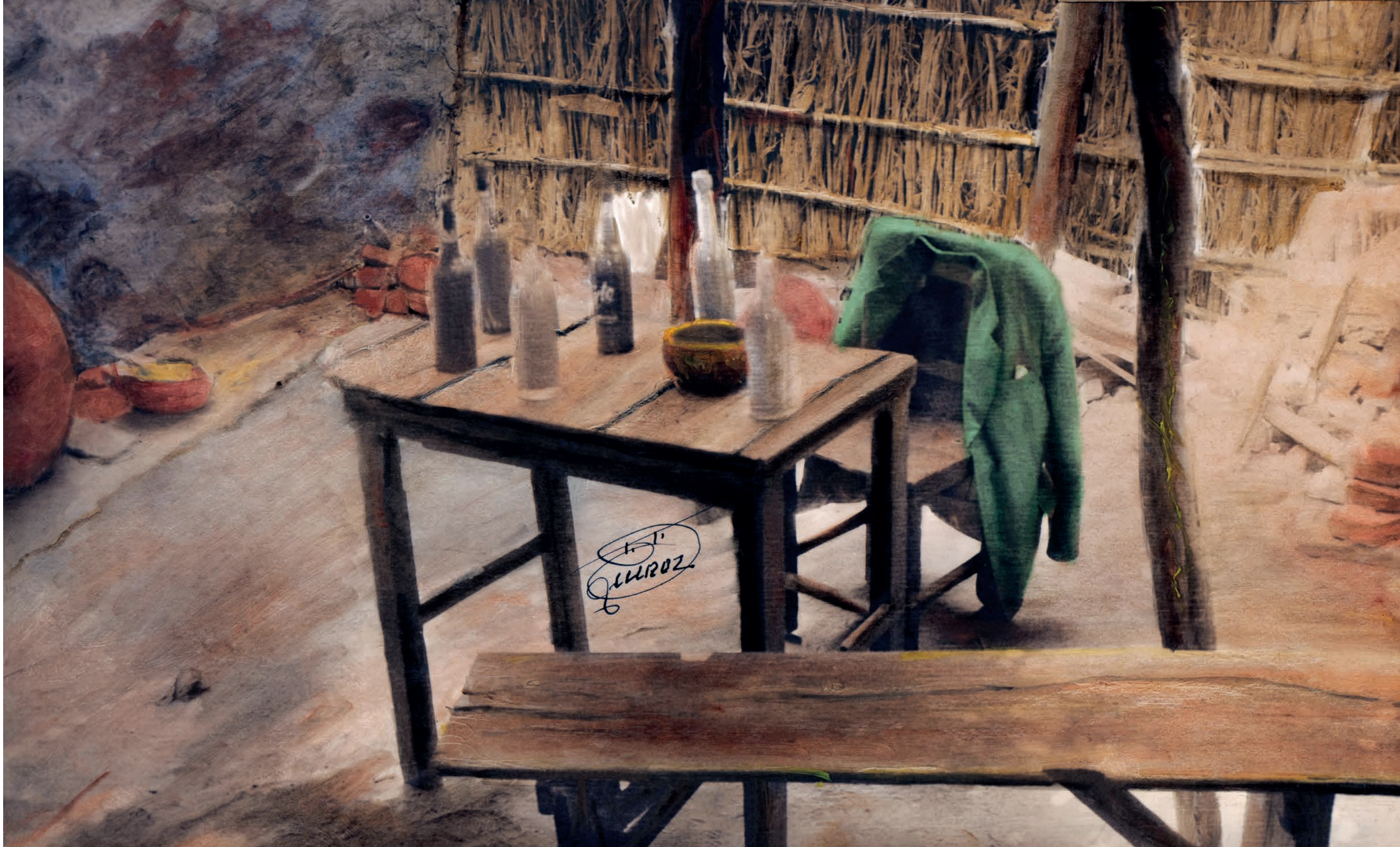
Un anisado para su bajamar , 1950. Foto-óleo sobre papel, 39 x 24 cm. Col. CIPCA.