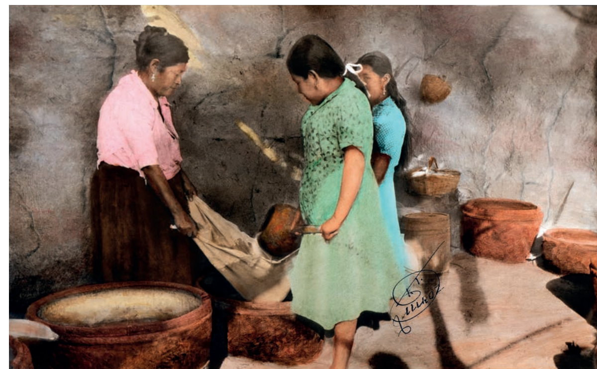
Taqueando , 1950. Foto-óleo sobre papel, 39.5 x 24 cm. Col. CIPCA.