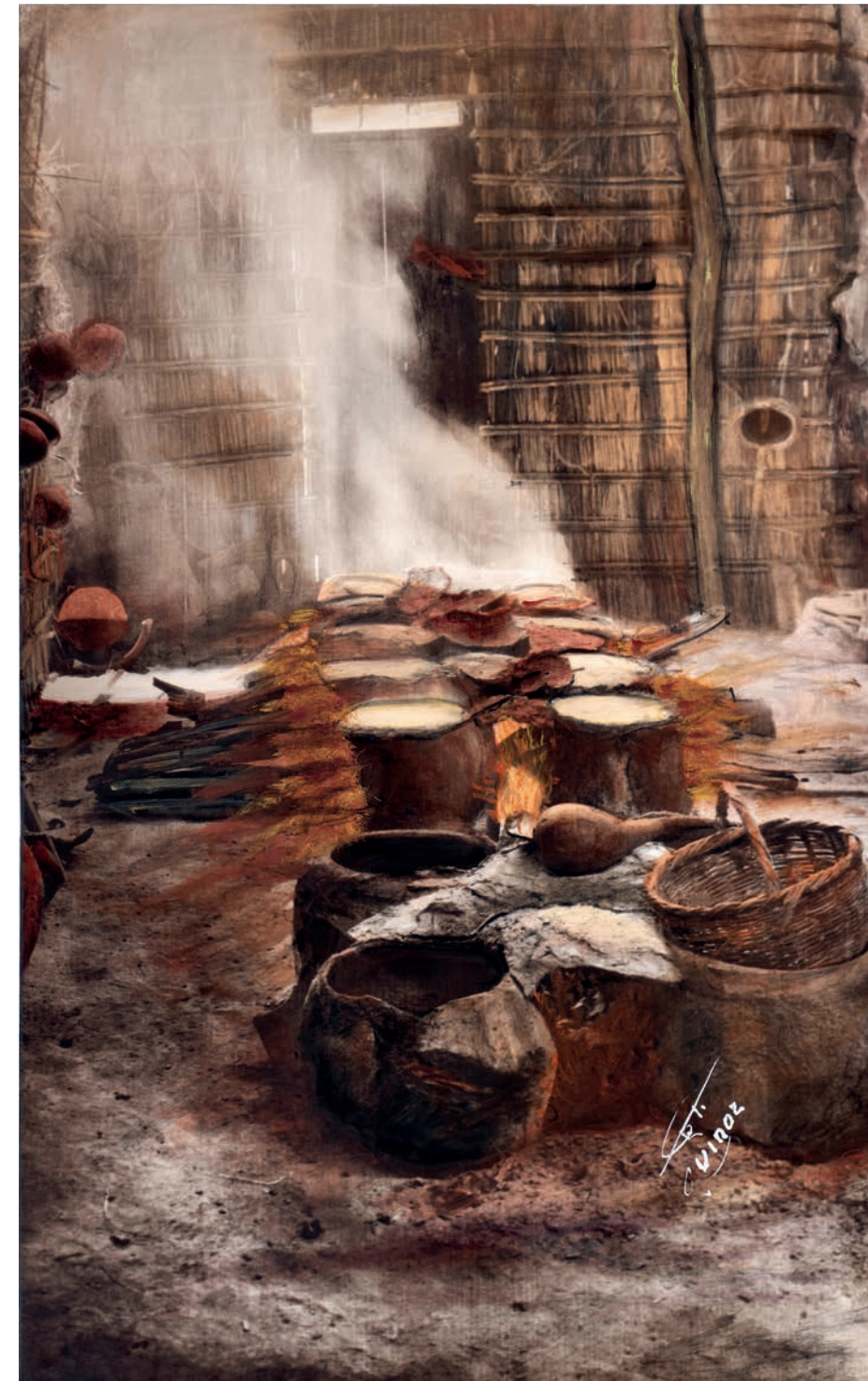
Taberna, cocinando chicha, 1950. Foto-óleo sobre papel, 39.5 x 24 cm. Col. CIPCA.