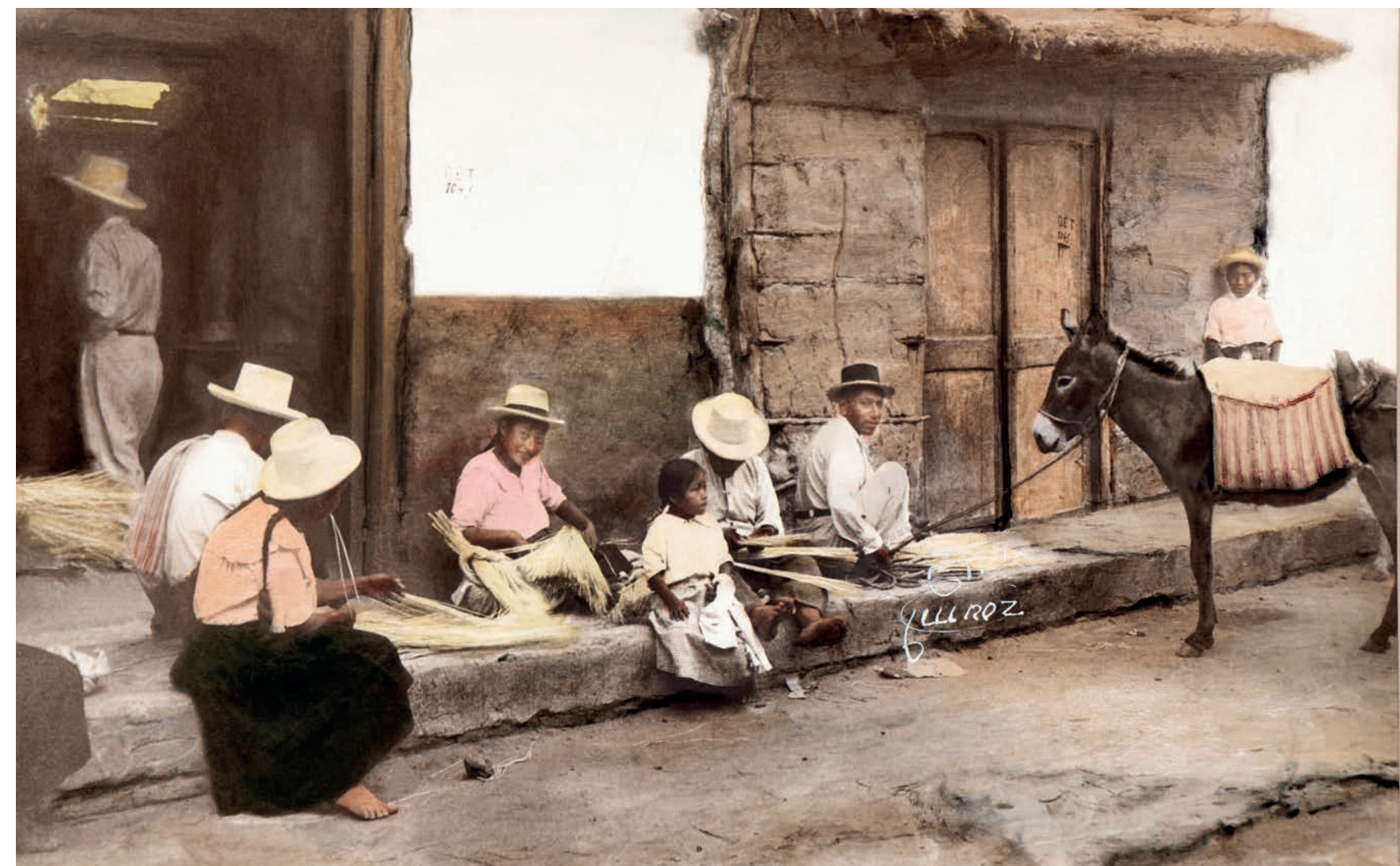
Escogedores de paja, 1950. Foto-óleo sobre papel, 39 x 24 cm. Col. CIPCA.