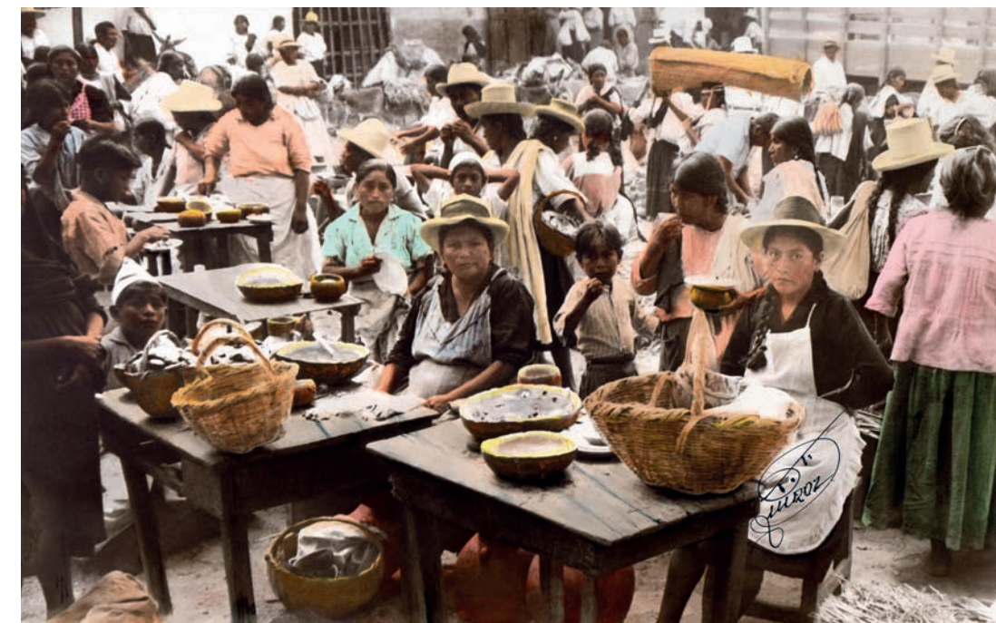
Feria dominical, 1950. Foto-óleo sobre papel, 39 x 24 cm. Col. CIPCA.