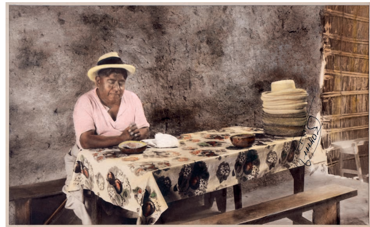
Comiendo un piqueo, 1950. Foto-óleo sobre papel, 39 x 24 cm. Col. CIPCA.