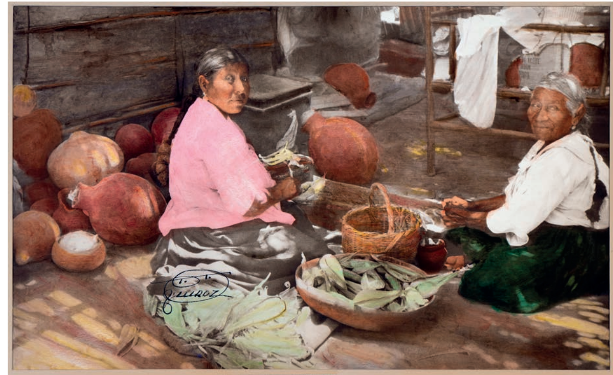
Preparando tamalitos verdes , 1950. Foto-óleo sobre papel, 39 x 24 cm. Col. CIPCA.