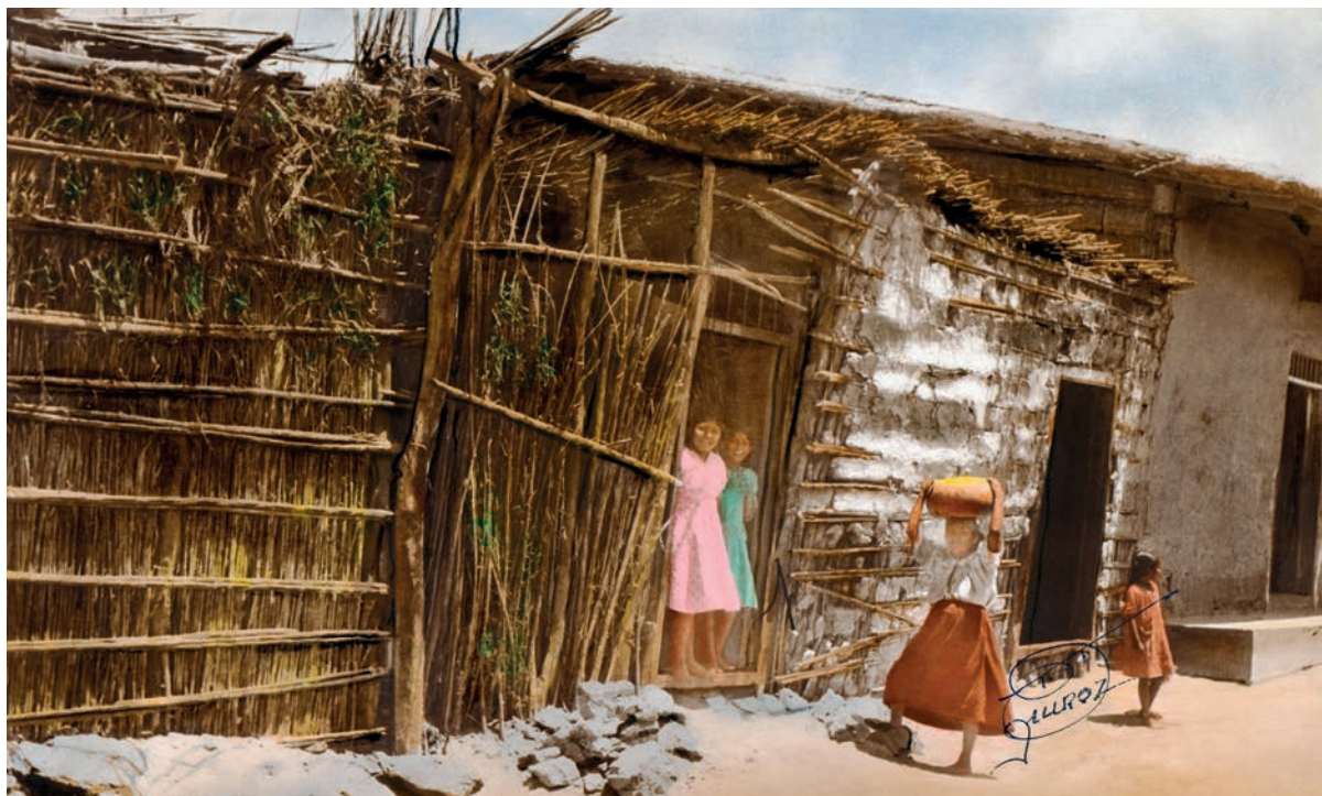
Chicherío El Palacio de cristal, 1950. Foto-óleo sobre papel, 39 x 24 cm. Col. CIPCA.