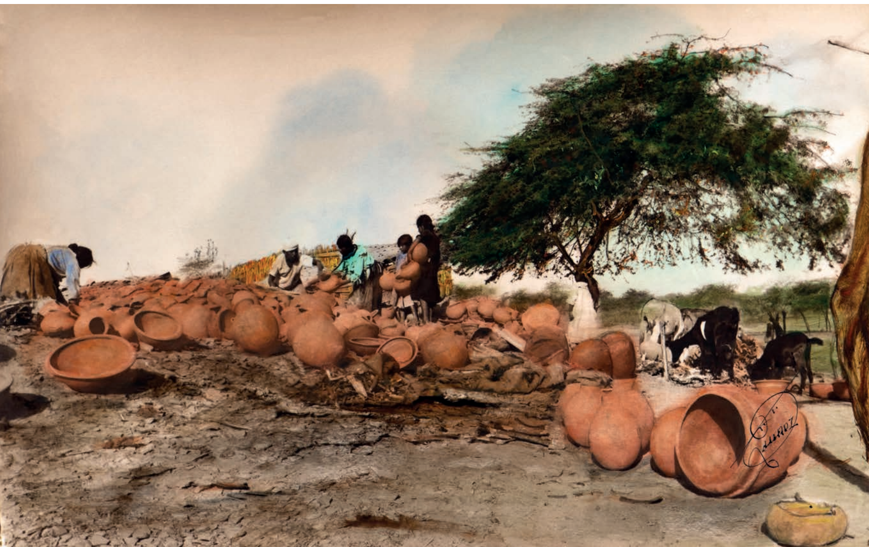
Desbaratando el horno , 1950. Foto-óleo sobre papel, 39.5 x 24 cm. Col. CIPCA.