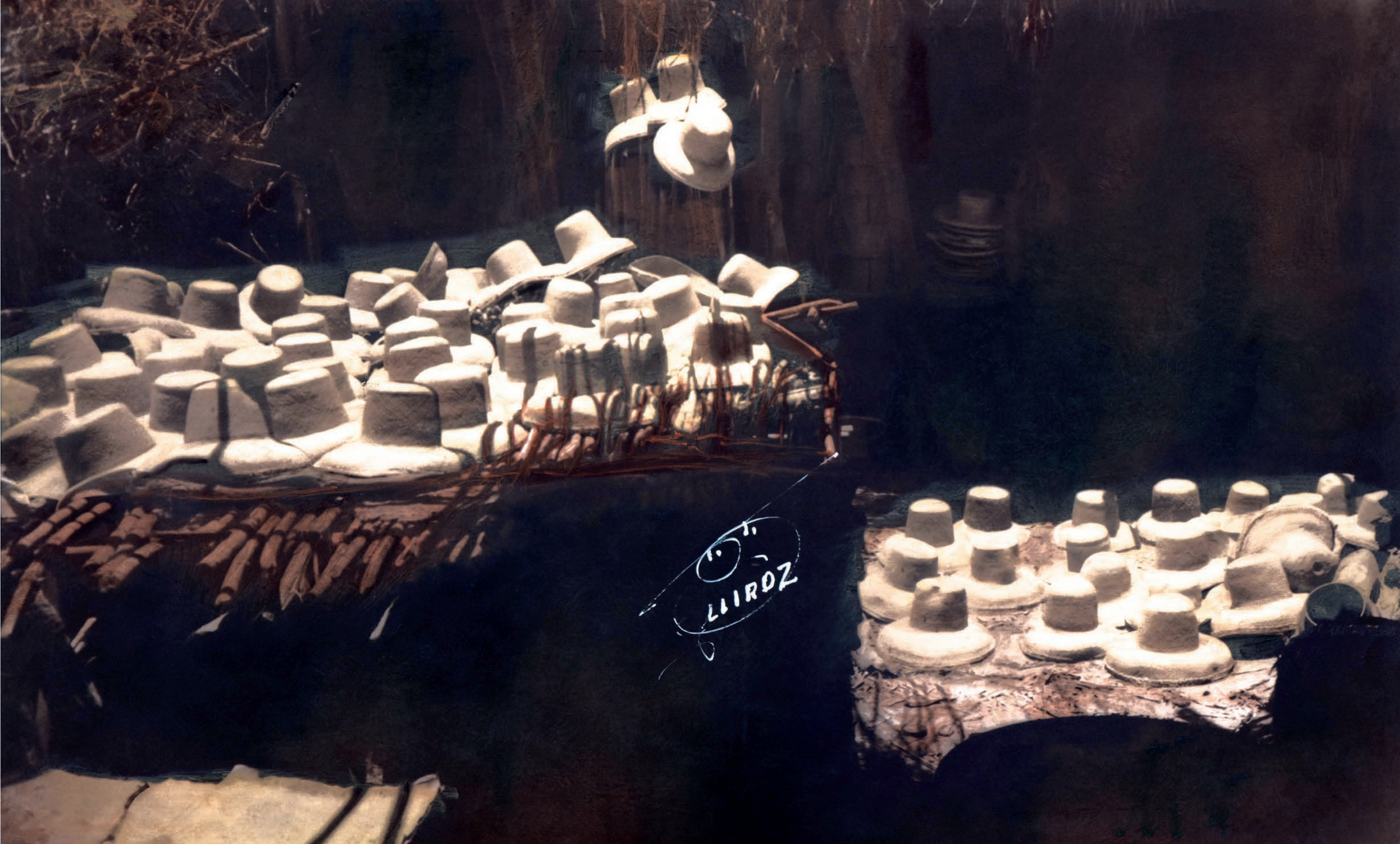
Secado de sombreros, 1950. Foto-óleo sobre papel, 39 x 24 cm. Col. CIPCA.