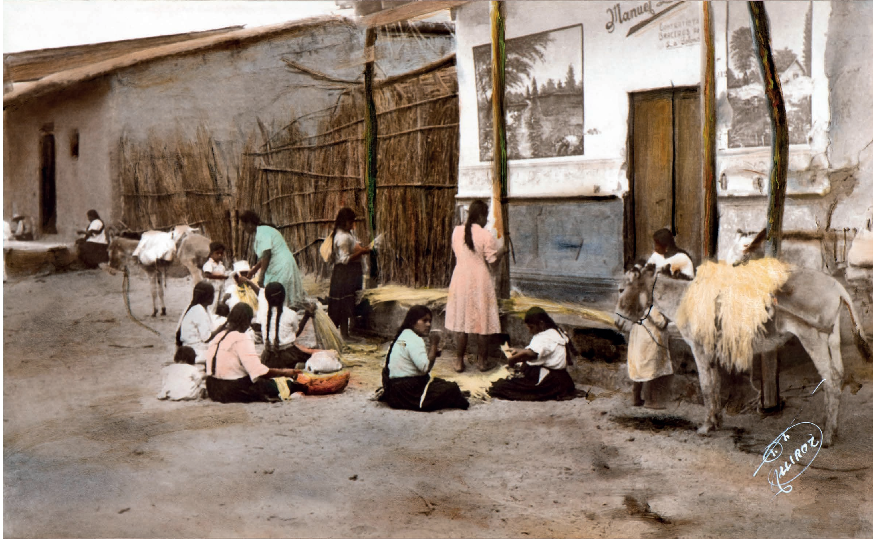
Escogiendo paja para los sombreros, 1950. Foto-óleo sobre papel, 39 x 24 cm. Col. CIPCA.