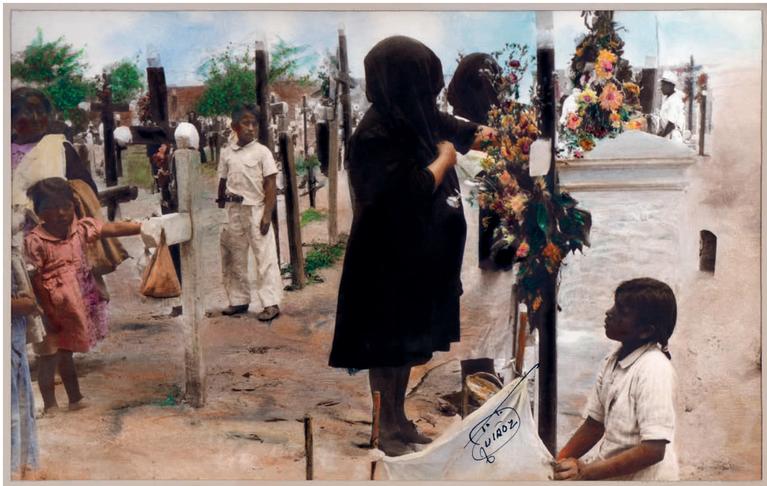
La llorona , 1950. Foto-óleo sobre papel, 39 x 24 cm Col. CIPCA.