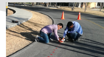
Evaluación del estado de pavimentos.