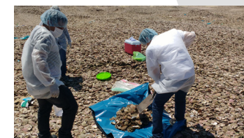
Proyecto sobre el uso de conchas de abanico.