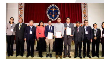
Los ganadores del 2019 fueron premiados en el Cipro.