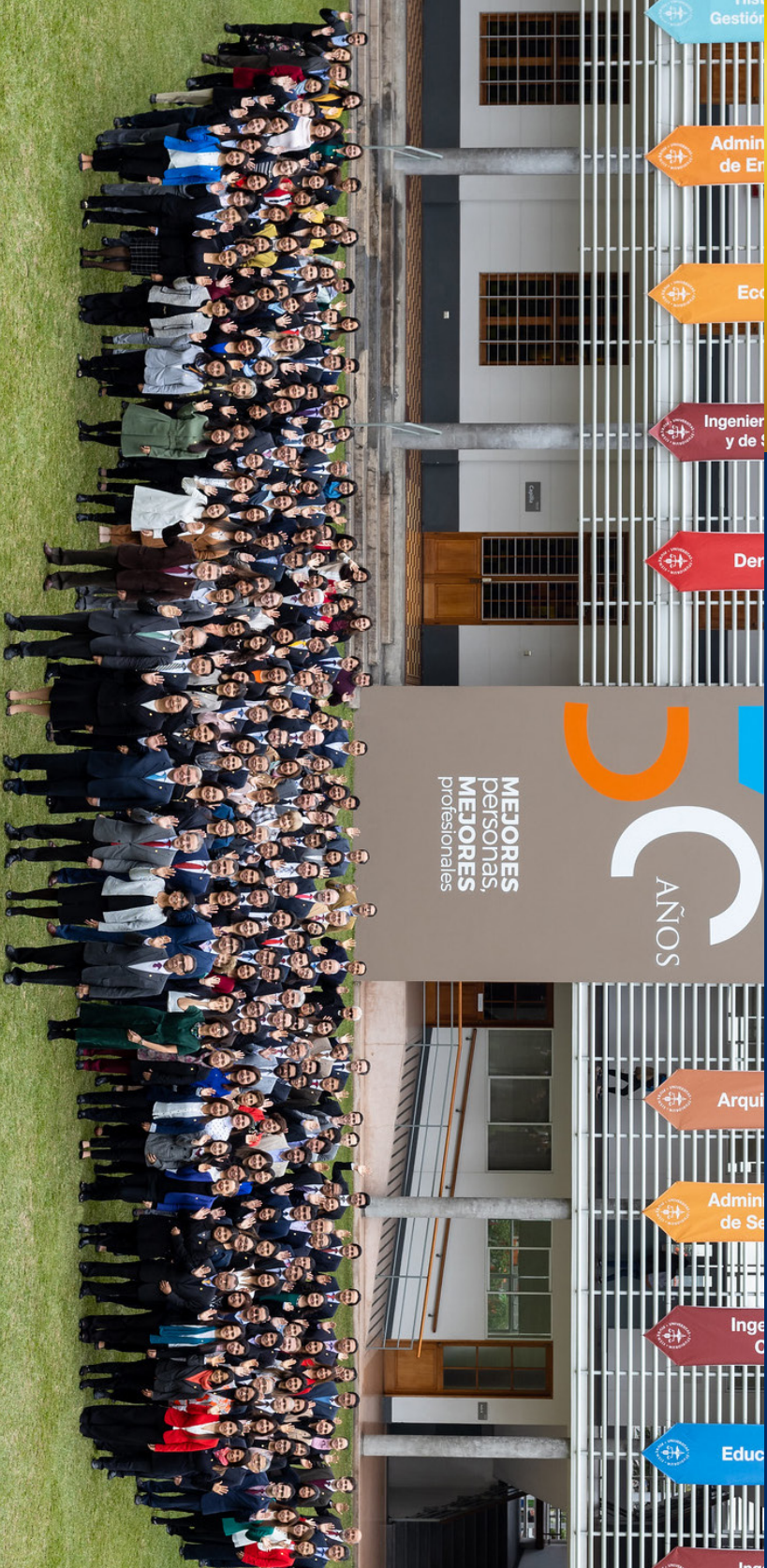
FOTO INSTITUCIONAL (LIMA) POR NUESTRAS BODAS DE ORO