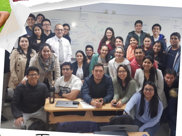
Fiamma Vives Ingeniería Industria y de Sistemas, Lima