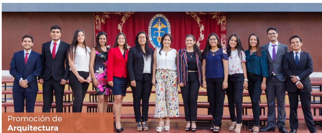
Promoción de Arquitectura

legó el momento del adiós o, más bien, del “hasta pronto”. Los chicos de las nuevas carreras se despidieron con ganas de comerse el mundo, luego de lograr la ansiada meta: culminar sus estudios universitarios