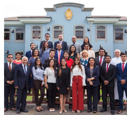
Promoción de Comunicaciones de Marketing