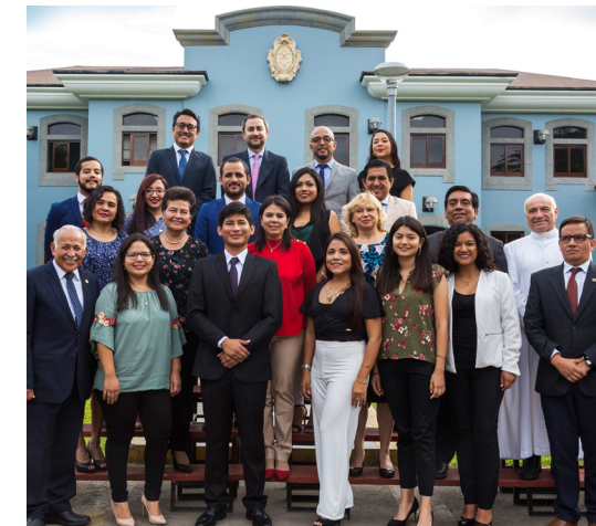
Promoción de Periodismo