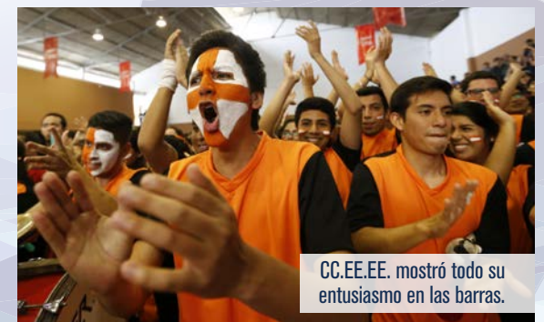
CC.EE.EE. mostró todo su entusiasmo en las barras.