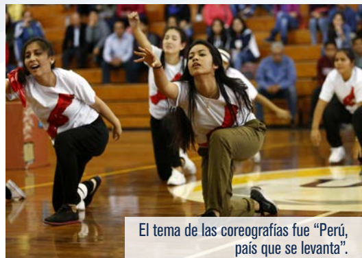
El tema de las coreografías fue “Perú, país que se levanta”.

En la jornada, el club de salsa exhibió una alegre coreografía, al son de “Ay mi Dios bendito”.