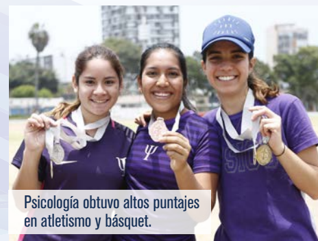
Psicología obtuvo altos puntajes en atletismo y básquet.

Polideportivo de la Universidad de Campus Lima, Estadio Luis Gálvez Chipoco, Colegio La Reparación y exteriores del Complejo Deportivo Manuel Bonilla.