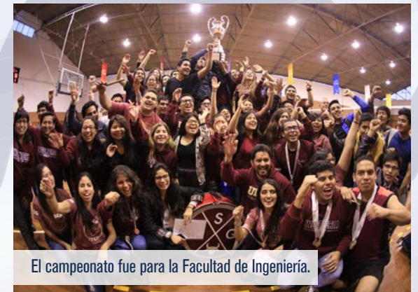
El campeonato fue para la Facultad de Ingeniería.