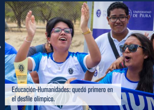
Educación-Humanidades: quedó primero en el desfile olímpico.

5 equipos: Ingeniería, Ciencias Económicas y Empresariales, Derecho, Comunicación y Educación-Humanidades.