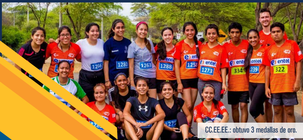
CC.EE.EE.: obtuvo 3 medallas de oro.