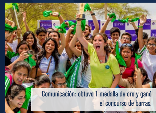
Comunicación: obtuvo 1 medalla de oro y ganó el concurso de barras.